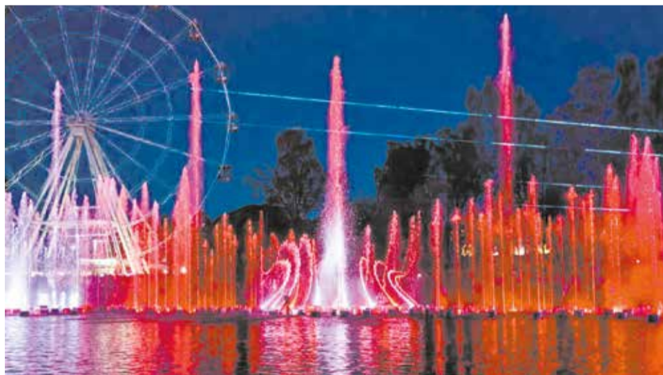
Новая инсталляция на открытии фонтана в парке имени Кирова.