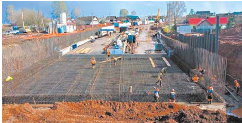
Процесс идёт: на тоннеле под Транссибом в Новоятске – стратегическом для области объекте – готовят стартовый и приёмный котлованы.

270 автобусов, принят комплексный план обновления коммунального хозяйства до 2030-го, ликвидировано более 160 свалок.