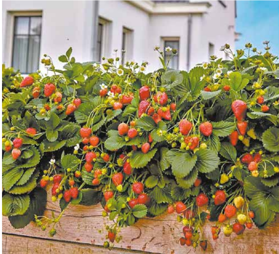
За хороший уход клубника отблагодарит обильным урожаем.

Ампельные сорта подходят для выращивания в подвесных кашпо.