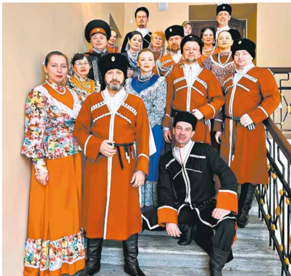
Ансамбль песни и танца «Казачи Вятки».

«Центр развития культурных инициатив» займётся популяризацией казачьей культуры среди кировчан, в том числе подрастающего поколения. Авторы проекта познакомят с историей и современной жизнью казачества, организуют фестиваль и гастроли в районах.