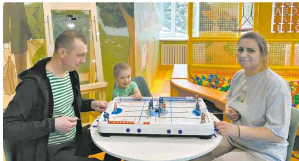
Один из принципов реабилитации – совместный отдых, общие занятия.