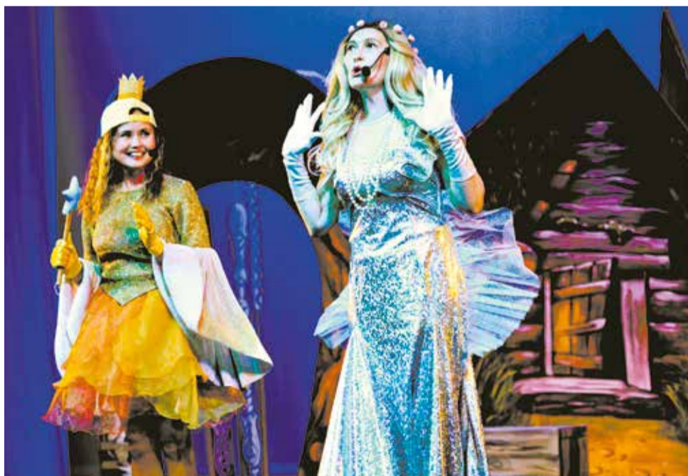
«Сказку о рыбаке и рыбке» смотрите в драмтеатре 21 и 22 мая.