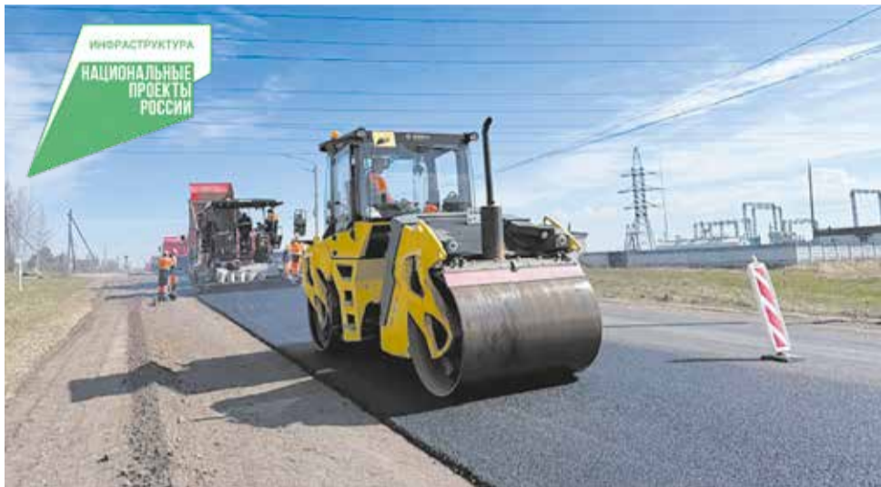
Асфальт укладывают на автодороге Сошени – Радужный.