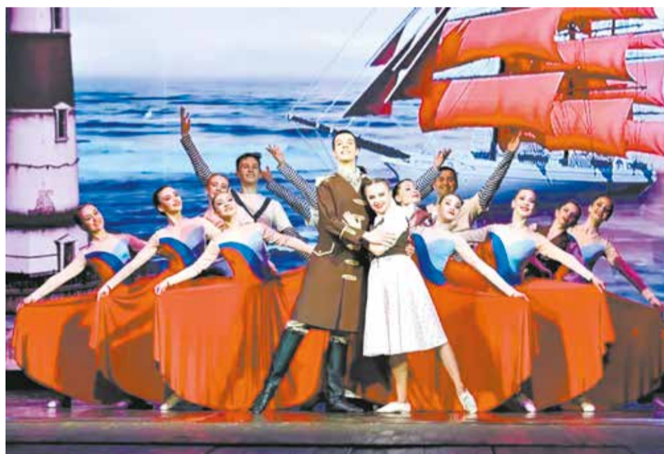
«Танцующая романтика Грина» в постановке театра «Гравитация».