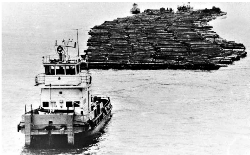
Сплав древесины на Вятке в черте Кирова (1992).

Подробности – на сайте киров.гранты.рф .