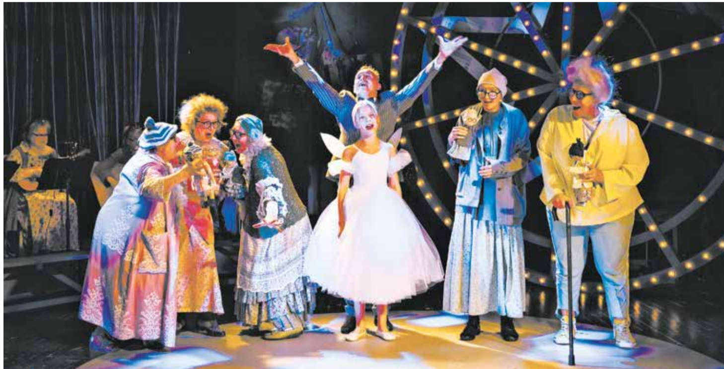
Мюзикл «О том, как Сергей Сергеевич прославиться хотел» по пьесе Николая Коляды поставил Пермский Театр-Театр.

гут посмотреть сказку Чуковского «Муха-цукотуха». 0+