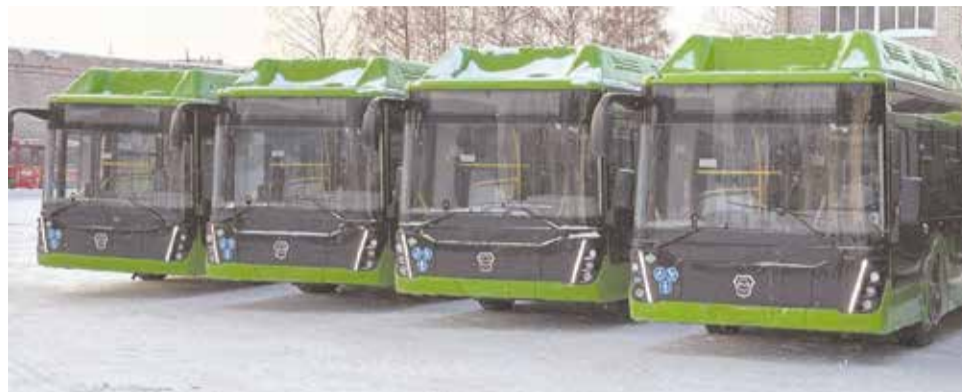
Новые «ЛиАЗы», поступившие в Киров, скоро выйдут на маршруты.

«Новые автобусы, поступившие в этом году, уже проходят процедуру приёмки, осмотр на предмет возможных дефектов, – пояснил начальник службы эксплуатации АО «АТП»