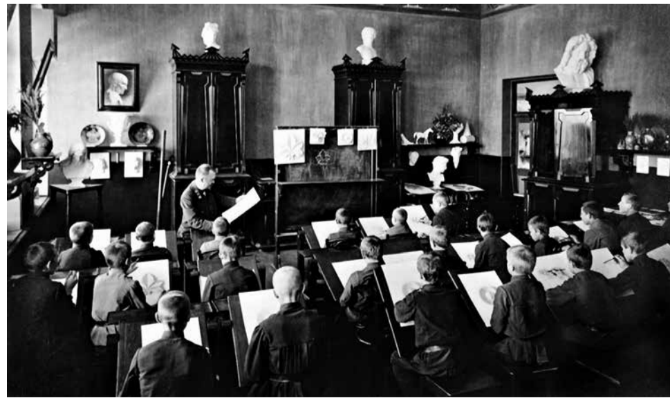
Урок рисования во втором корпусе мужской гимназии, построенном по проекту Ивана Чарушина (ныне – Вятская гуманитарная гимназия на Свободы, 76). Фото начала XX века.