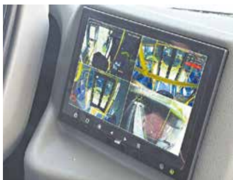
Место водителя и салон оснащены современными системами.