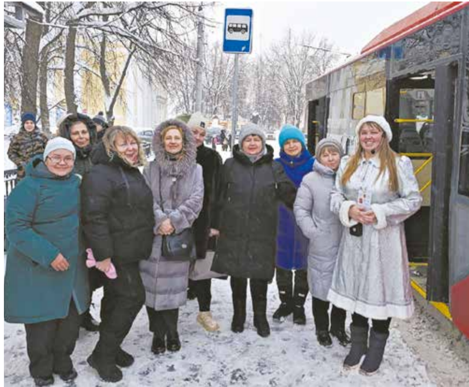
Экскурсии, подготовленные управлением культуры, популярны у кировчан.

Особенно популярны были летние пешеходные экскурсии (число желающих попасть на каждую доходило до ста человек). Экскурсоводы знакомили жителей и гостей города с улицами и районами Кирова, интересными памятниками и историями, с ними связанными, рассказывали о жизни известных уроженцев и жителей Вятки, раскрывали тайны