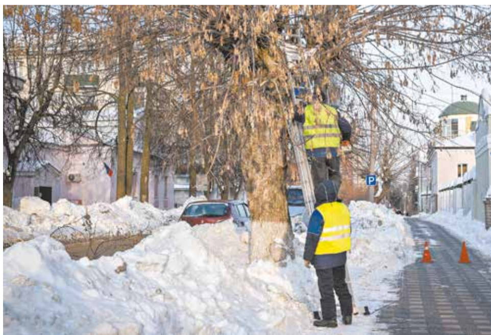
Омолаживающую обрезку и валку аварийных деревьев в городе выполняют четыре бригады.

Уборка дикой поросли, сухих и гнилых деревьев с улиц города продолжается.