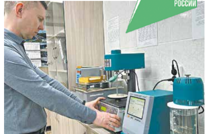
В Дорожном комитете идёт поверка приборов.

Как сообщили в областном минтрансе, значительные объёмы работ запланированы также на региональной трассе Киров – Малмыж – Вятские Поляны, входящей в опорную сеть автомобильных дорог РФ. К нормативу приведут также более 14 км в Кирово-Чепецком, Вятскополянском районах и Уржумском муниципальном районе – на дороге, обеспечивающей связь с Татарстаном.