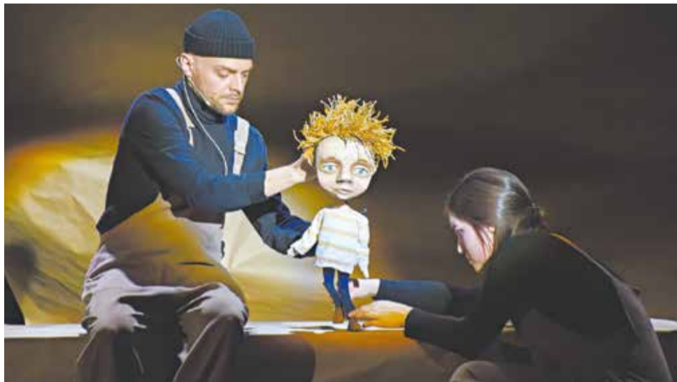
Режиссёрские лаборатории помогают установить диалог со зрителем.