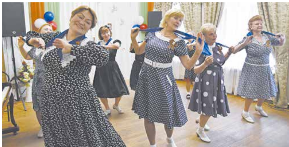
Городской клуб ветеранов – место для отдыха и общения.

Администрация МБУ «Городской клуб ветеранов»