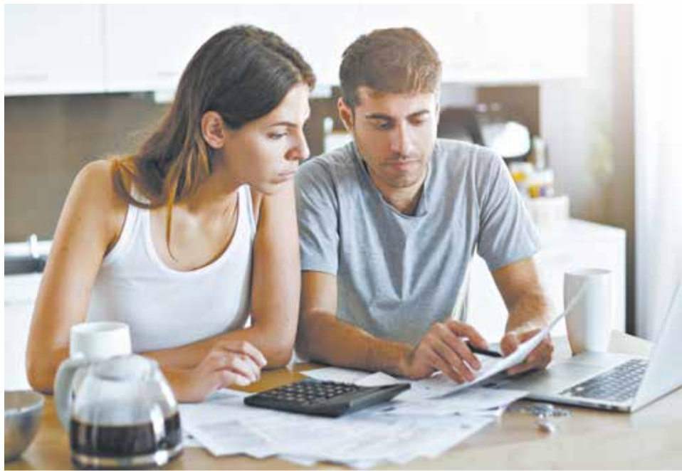
Составьте финансовый план на год и следуйте ему.

ных целей на год, например, сделать ремонт и купить машину. Сразу обозначьте сумму и оцените, какие у вас доходы и расходы, сколько сможете откладывать в месяц. Может, стоит расставить приоритеты и что-то вычеркнуть из списка?