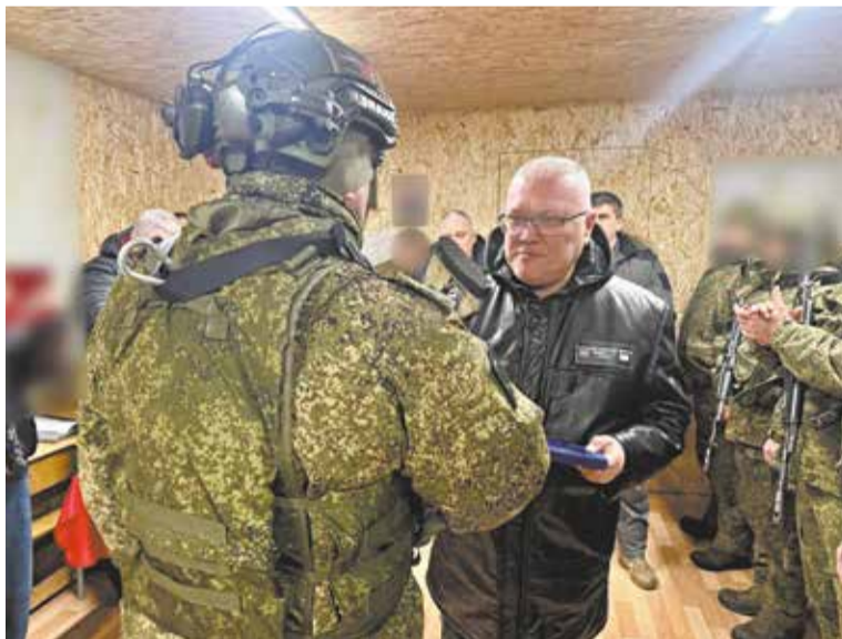
Глава региона вручил бойцам почётные знаки и грамоты.

Глава региона также сообщил, что нашим бойцам был передан большой гуманитарный груз – несколько фур: «Пять квадроциклов, генераторы, аккумуляторы, рации, тепловизорные прищелы – всё, что просили в первую очередь. А ещё тысячу листов OSB-плиты и другие стройматериалы для укрепления сооружений, 17 тонн топливных пеллет. Груз помог собрать