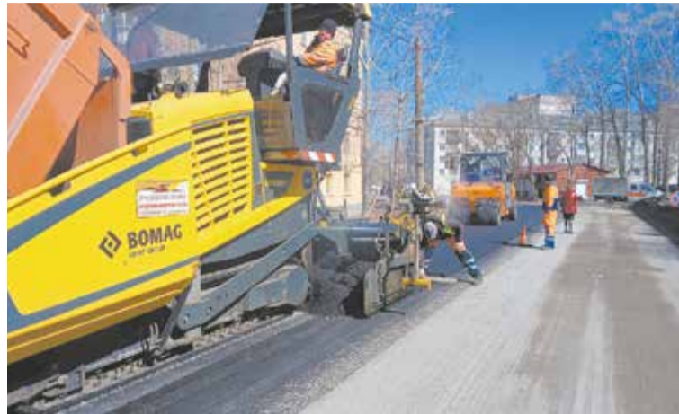
На ремонт дорог в Кирове в этом году выделят более 600 млн руб.