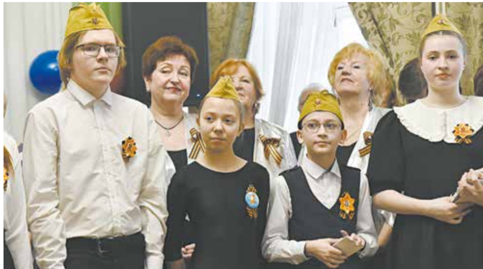
Патриотическое воспитание молодёжи – одна из задач клуба.

Большой интерес у кировчан вызвал спектакль коллектива «Время оптимистов», поставленный по пьесе кировского писателя Виктора Бакина «Детдомовские сороковые». К 80-летию Победы были подготовлены мероприятия «Не уйдёт из памяти война», «Кировчане – фронту», «Под флагом