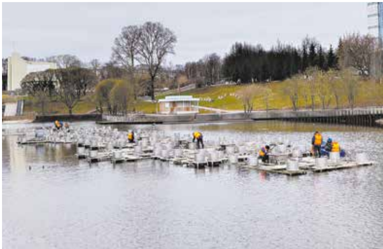
На пруду у цирка снова будут устраивать светомузыкальное шоу.