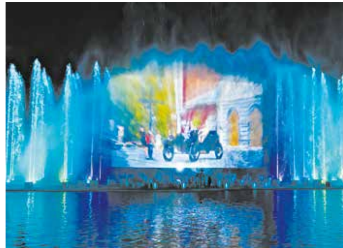
В прошлом году фонтан стал центром притяжения кировчан.

Напомним, фонтан был открыт к Дню города в сентябре 2025-го, имеет немаленькие размеры (76 на 16 м) и уникальный дизайн, напоминающий кукарское кружево – известный вятский промысел. Он включает 166 динамических струй (самая высокая – до 35 м) и водный экран для про-