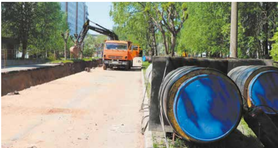
В планах на ремонт-2026 – более 9 км теплотрасс.

«Т Плюс» реконструирует тепловые сети и котельные города Кирова для повышения надёжности теплоснабжения областного центра.