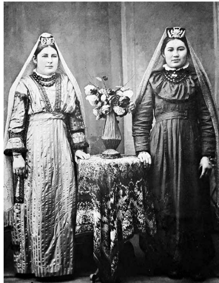
Татарские женщины (Малмыж, начало XX века).