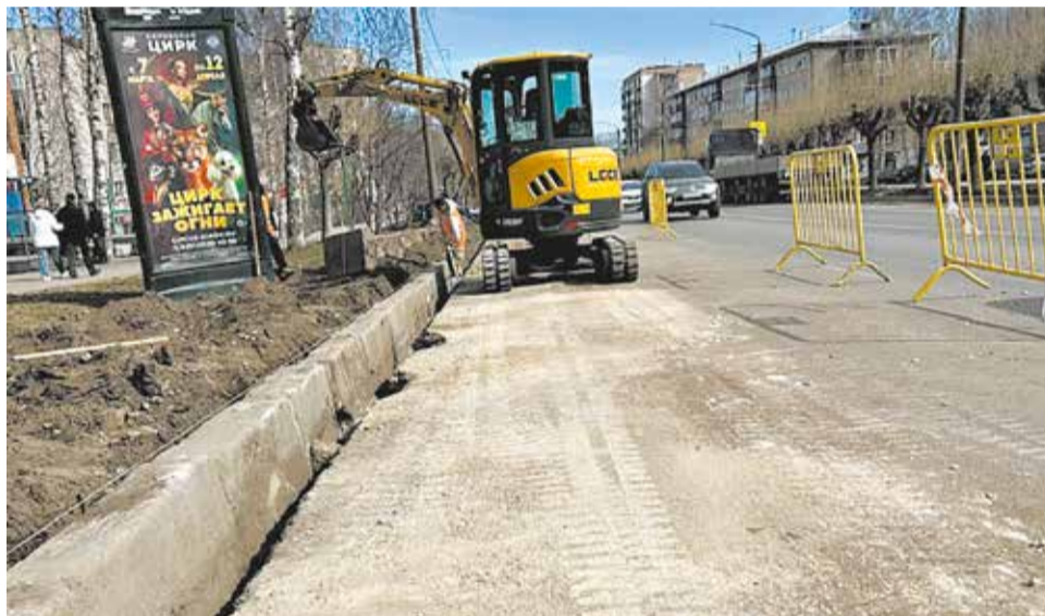
На улице Лепсе начался ремонт дороги на средства нацпроекта.

В тему. В рамках национального проекта «Инфраструктура для жизни» стартовал ремонт дорог на участках улиц Лепсе и Тракторной и на Октябрьском проспекте. Подряд-