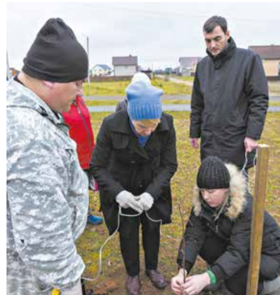
Более 1,3 млн руб. выделено на развитие нового парка имени Логинова в Дороничах.