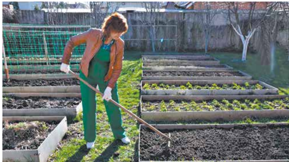
Лето не за горами – позаботьтесь о здоровье ног весной.

При этом методе особенно хорошо поддаются лечению сосуды небольшого диаметра, в частности эффективна склеротерапия сосудистых звёздочек. Пациенту не нужно ложиться в стационар или проводить много времени в клинике. Достаточно 20 минут, чтобы сделать инъек-