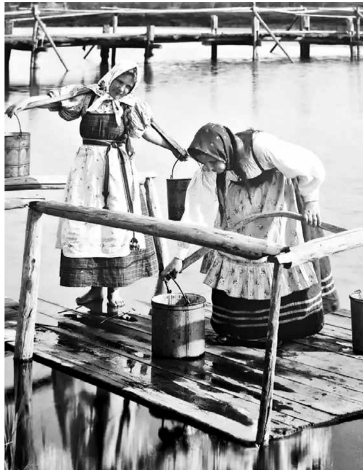
Сергей Лобовиков создал фотолетопись крестьянской жизни.