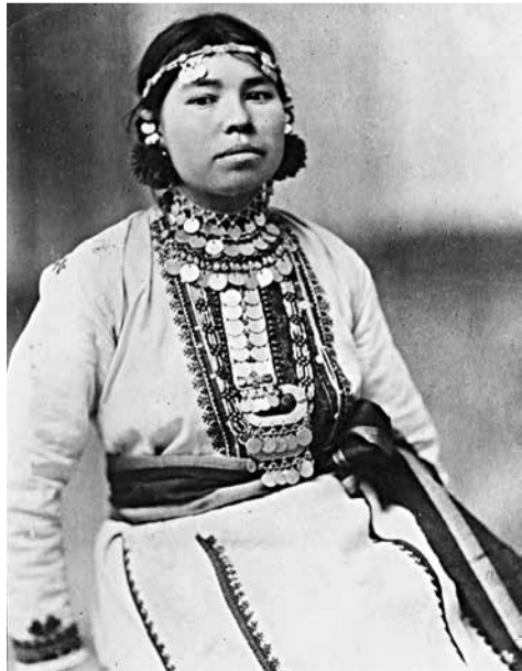
Прямой потомок марийского князя Болтуша.

Количество приданого зависит от материального состояния семьи. Рубашек и сарафанов домотканых может быть от 1 до 20. У зажиточной невесты есть и верхняя одежда – шуба, овчинный тулуп, покрытый сукном, стёганая кофта, зипун, скатертей до 10 штук, полотенца до 20, платков до 30, несколько перовых подушек».