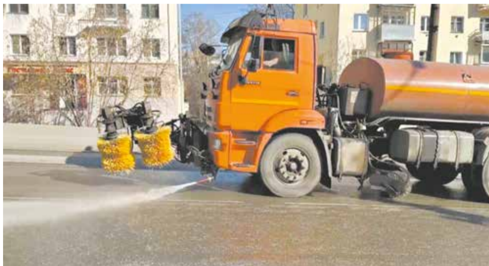
Поливомоечные машины выходят на дороги днём.

чики меняют бортовые камни, при благоприятной погоде начнут фрезерование.