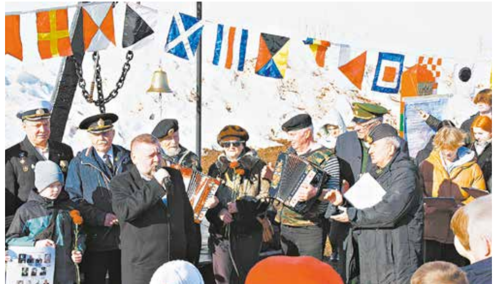
Презентация гимна прошла в Кирове – у памятника «Якорь».

Сколько героев мы знаем, Чтим свято павших в боях,