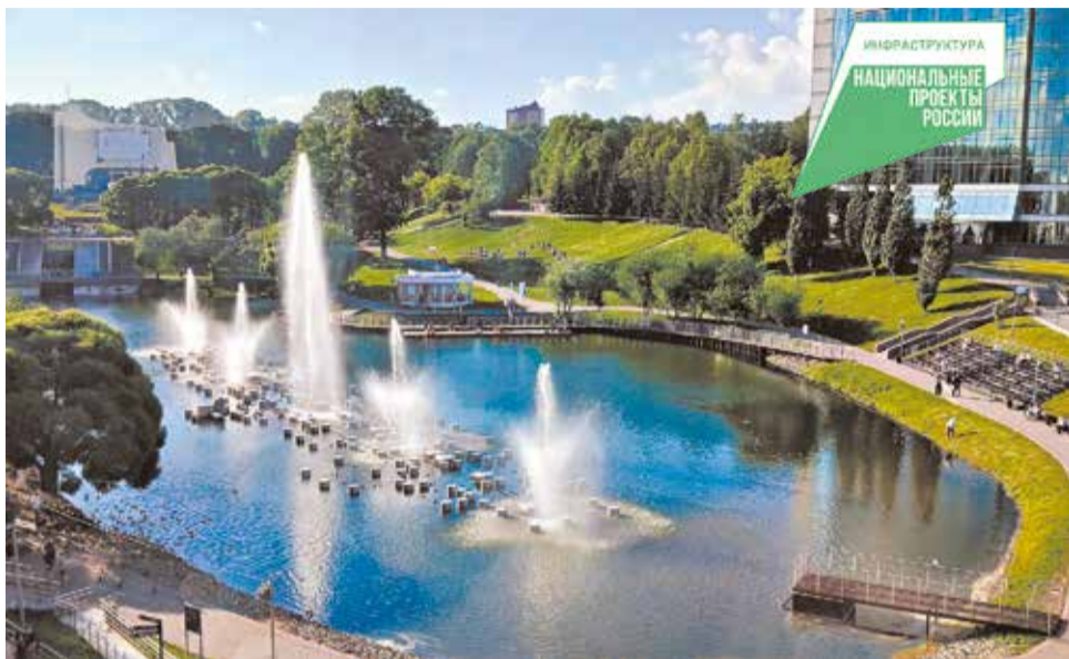
Парк имени Кирова обновляли по нацпроекту поэтапно, в течение нескольких лет.

Кировчане проголосовали за ремонт сквера на Щорса