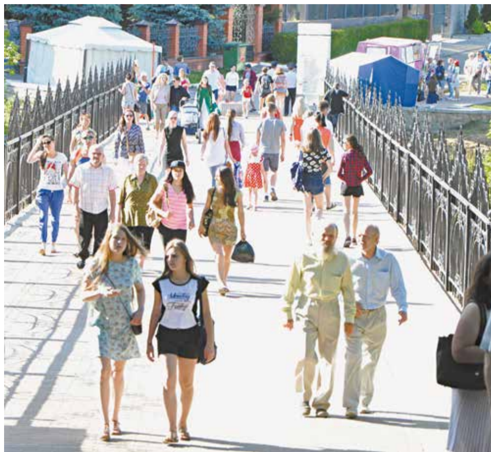
Чтобы долгие прогулки не доставляли дискомфорта, надо позаботиться о своих ногах.

мышцы; перенаправляют давление с повреждённых участков на здоровые; не только ограничивают нежелательные движения, но и учат тело двигаться правильно. Например, детские ортезы при косолапости постепенно исправляют положение стопы и формируют здоровый двигательный стереотип.