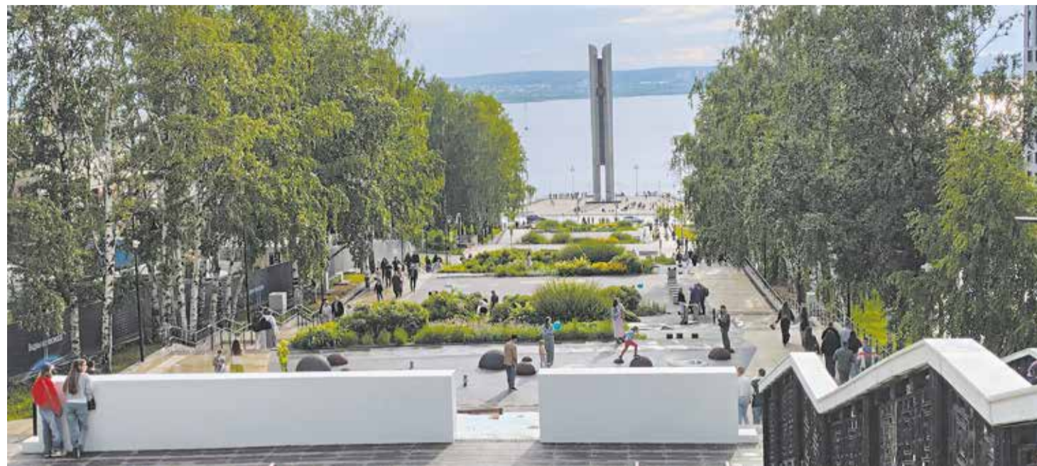
Новый лестничный спуск на набережную, с которого открывается вид на Ижевский пруд и монумент «Навеки с Россией».

Изучаем культуру соседей, пробуем пельмени и перепечи