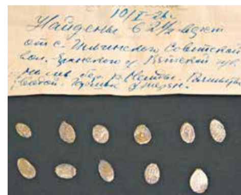
Серебряные монеты, найденные в Яранском уезде в 1920-е.