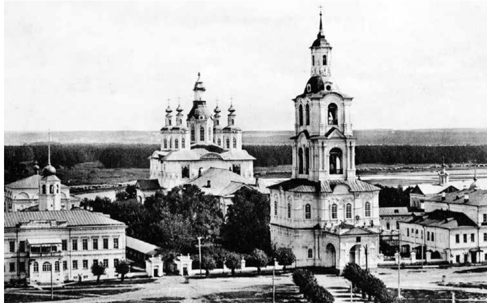
Кафедральная площадь с Троицким собором (уничтожен в 1930-х годах).

был завален битым камнем, и земля постепенно скрыла выложенную кирпичом галерею, которая превратилась в «подземный ход».