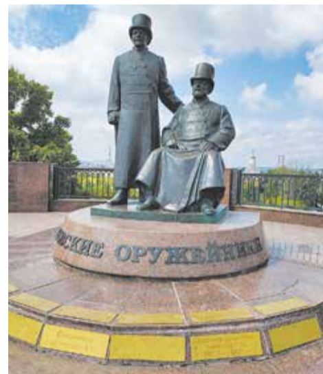
Памятник ижевским оружейникам.

Есть шанс прокатиться на ретропоезде: «Чайковский экспресс» следует из Ижевска в Воткинск, «Жулический экспресс» – в Сарапул (расписание на сайте РЖД). Афишу культурных событий найдёте в группе «Парки Ижевска», аудиоэкскурсии – на сайте izi.travel . Загляните и в красный павильон туристско-информационного центра на Центральной площади.