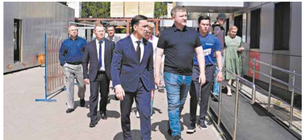
Повышение доступности медпомощи – один из приоритетов.