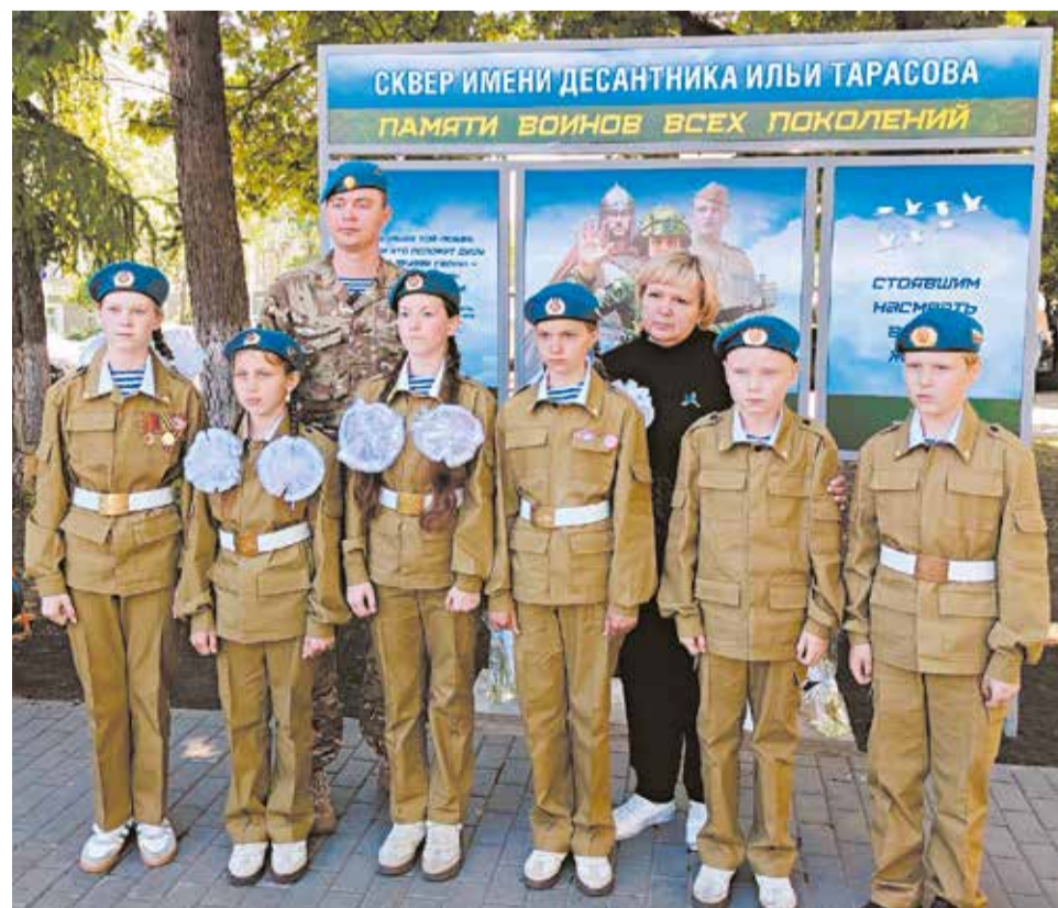
На открытие собрались школьники, педагоги, ветераны, боевые друзья.