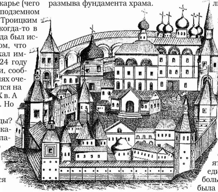
Так выглядел Хлыновский кремль.

В 1903 г. вокруг Александро-Невского собора был сделан кольцевой дренажный канал, из которого вода сбрасывалась в два естественных поглощающих колодца. Эта система была сооружена, чтобы не допустить размыва фундамента храма.