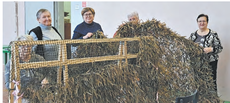
Волонтеры посёлка Костино работают день за днём.