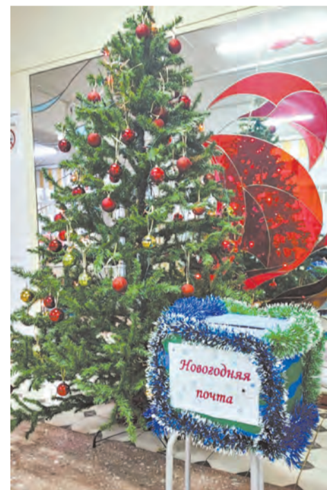
Гимназия им. Грина (1-е место среди школ) создала новогоднее настроение.