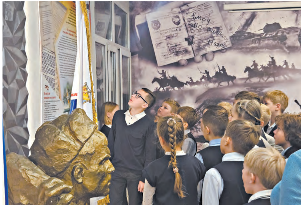
В Кировском физико-математическом лицее создан музей Якова Падерина.

взять деревню Рябиниху. Немцы организовали здесь мощный опорный пункт с укреплениями и дзотами. Более 400 метров по глубокому снегу пробиралась группа солдат, возглавляемая Падериным.