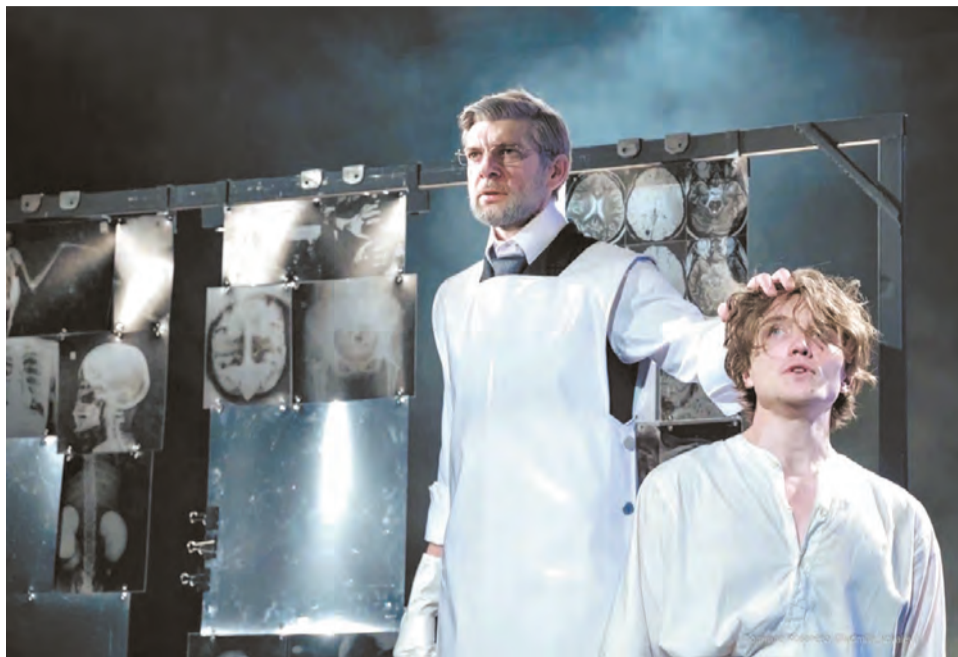
Гастрольный спектакль «Собачье сердце» смотрите в драмтеатре 20 марта.

сферу создаёт хор – тролли, гости на свадьбе, пассажиры корабля.