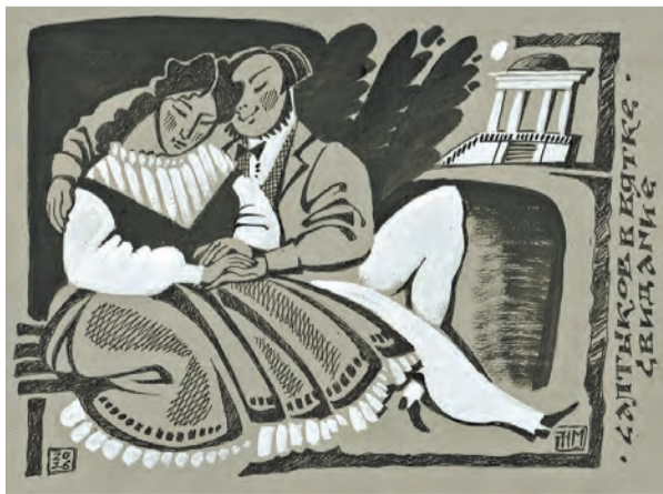
Салтыков с невестой Лизой Болтиной. Рисунок Максима Наумова.