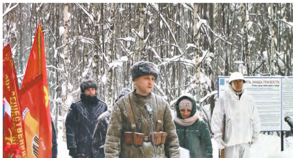
Кадр из фильма Алексея Фоминых «Живы в памяти потомков» – открытие памятника 355-й стрелковой дивизии в д. Рябинихе.

Наталья Владимировна