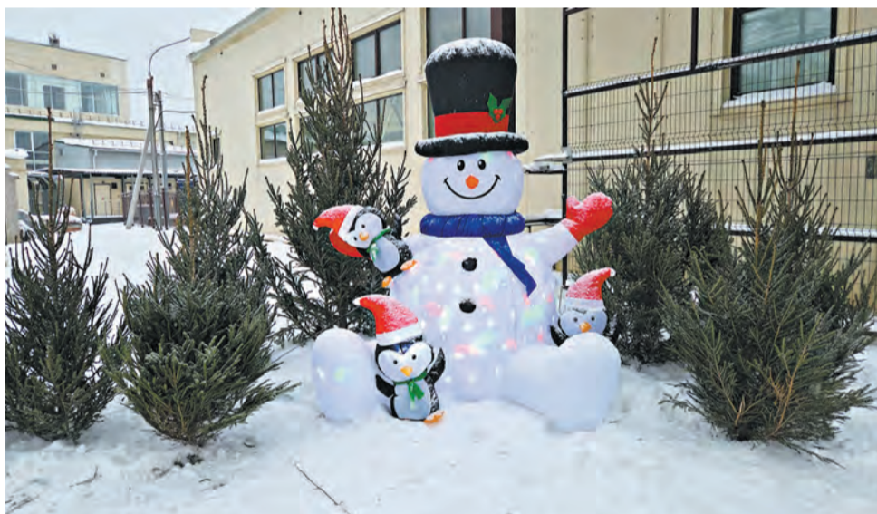
Кировский молочный комбинат, победивший в номинации «Зимнее вдохновение», украсил и внутреннюю территорию.