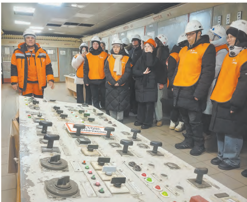
Пятнадцать добровольцев проведут уроки безопасности.

Напомним, проект «Волонтёры тепла» стартовал в Кирове в марте 2025 года. Тогда школьники и студенты провели 34 урока для более 800 учащихся. Проект был отмечен дипломом премии «Серебряный лучник – Приволжье» в номинации «Коммуникации в сфере устойчивого развития».