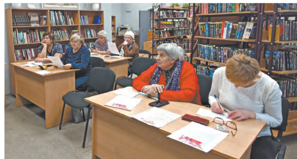
Внимание уделяется повышению компьютерной грамотности старшего поколения.

В течение года велась борьба с незаконно размещёнными средствами наружной информации. По выявленным нарушениям было направлено 206 информационных писем, вынесено 37 предписаний, составлено 3 протокола.