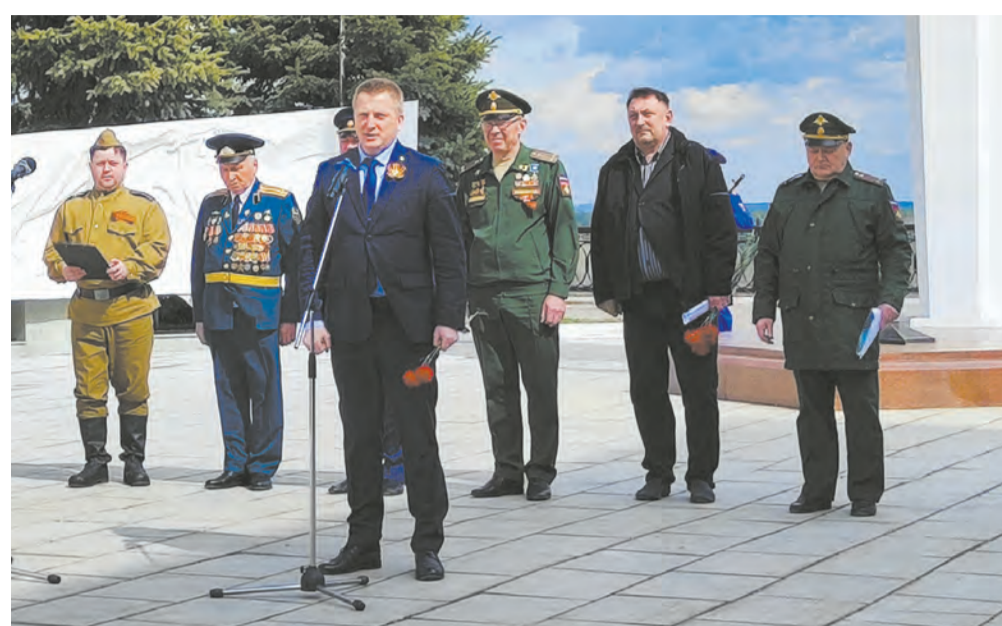
Юбилейный День Победы стал одним из главных праздников прошлого года.