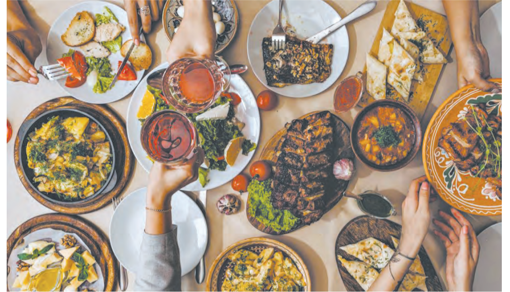
Последствия переедания могут быть опасны.

пить стакан воды. Она слегка заполнит объём желудка и поможет вам меньше съесть.