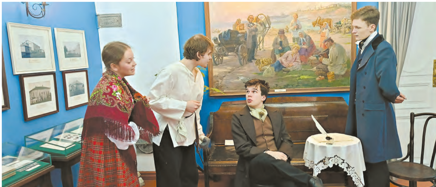
Сцена из спектакля «Крутогорские будни советника Салтыкова», показанного в музее сатирика.

Как жил, работал и проводил досуг Салтыков-Щедрин, можно узнать на выставке в доме-музее на Ленина, 93.