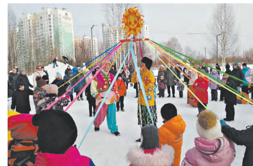
Праздники во дворах организуют теруправление и центры местной активности.

Для повышения привлекательности района, комфортного проживания и культурного отдыха населения в 2025 году проводились комплексные работы в рамках муниципальных программ (в том числе окраска и ремонт изгородей в скверах, ремонт ограждений и перекладка брусчатки на набережной Грина, ремонт стелы «Киров» на трассе Киров – Юрья и въездного знака «Киров» на Котельничском тракте и многое другое). Обустроены площадки для выгула собак в парке им. Гагарина (на сумму 997,4 тыс. руб.) и по ул. Клубной, 11 (820 тыс. руб.).