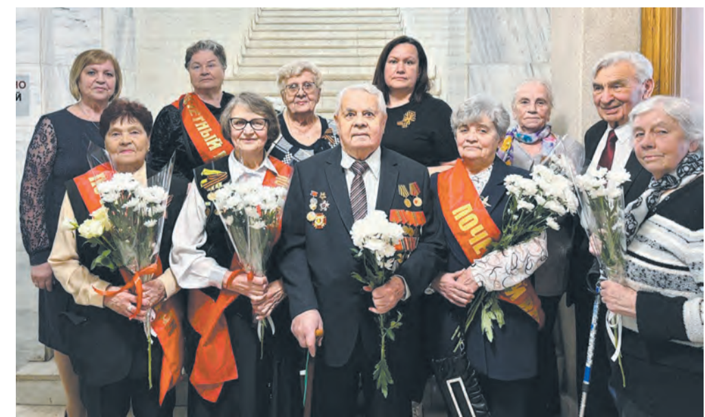
Особые почести в юбилейный год – ветеранам войны и труда.

Второй год от Первомайского района подаётся заявка на участие в конкурсе «Лучший сельский населённый пункт Кировской области». В прошлом году деревня Малая Субботиха заняла 2-е место в номинации «Здоровое село» среди населённых пунктов численностью от 500 до 3000 человек. Грант в размере 500 тыс. руб. направлен на благоустройство территории у памятника павшим на войне односельчанам.