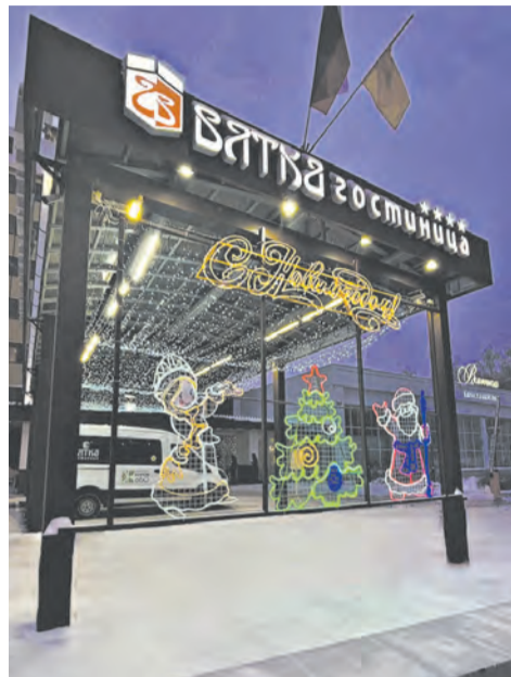
Гостиница «Вятка» вновь вошла в число победителей.