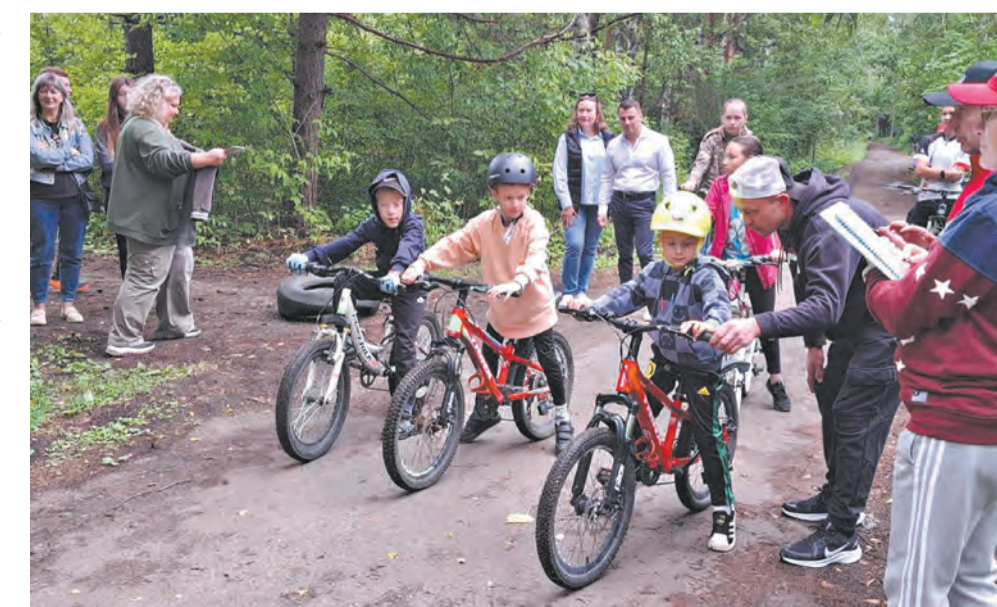
Спортивные мероприятия проходят при поддержке депутатов ОЗС и Думы. Материалы и фото Первомайского ТУ

ремонт памятников на территории района (897,7 тыс. руб.): стела воинам-дымковчанам (сл. Дымково, ул. Луначарского); погибшим воинам (с. Порошино, ул. Боровицкая); стела советским солдатам (д. Малая Субботиха, ул. Школьная); памятник землякам, погибшим в боях за Родину (ул. Клубная, 1); советским солдатам (ул. Красной Звезды, 16); скульптура воина (п. Сидоровка, ул. Братьев Васнецовых).