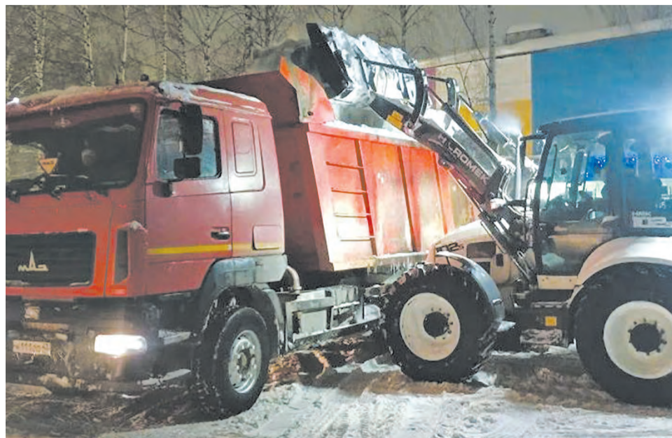
В этом году снега на полигоны вывезли намного больше, чем в прошлом.

Как рассказали в подрядной организации АО «Гордормостстрой», работы ведутся в основном ночью. Если днём в вывозе снега задействованы два звена спецтехники, то в ночное время – шесть. На улицах, как правило, ежедневно работают более 100 машин и около сотни специалистов ручного труда. После сильных осадков подрядчики в первую очередь чистят путепроводы и мосты, затем магистральные улицы, после – второстепенные.