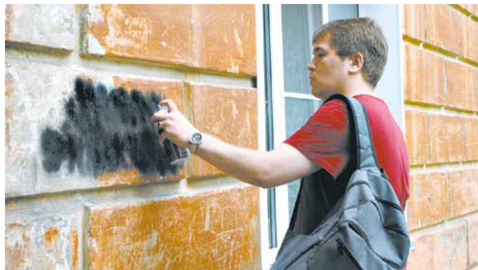
В Кирове регулярно проводятся рейды по выявлению и закраске надписей, рекламирующих наркотики.

Поощряйте здоровые привычки: помогите составить распорядок дня