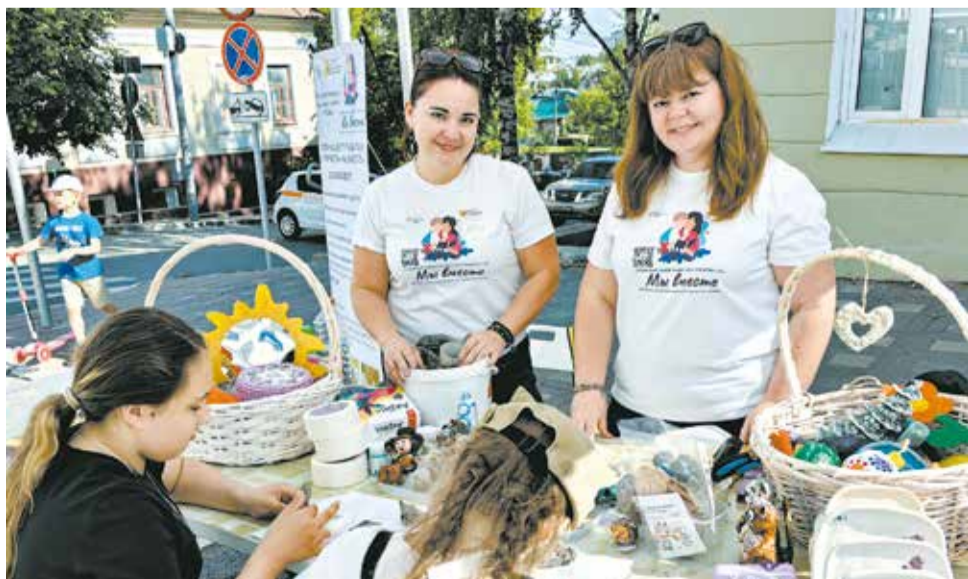
Представители клуба «Мы вместе» участвовали в ярмарке на Спасской.