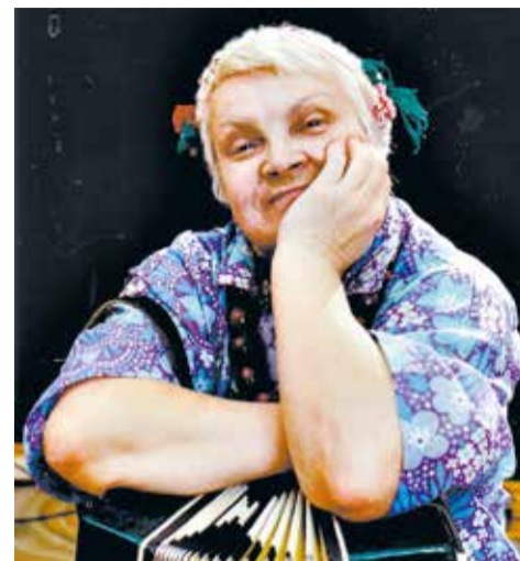
Народная артистка России Г. Малышева.

30 июля 105 лет назад родился писатель-фантаст Борис Ляпунов (1921–1972), автор научно-фантасти-