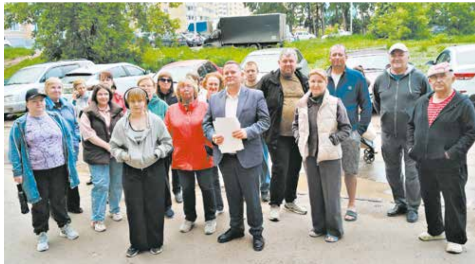
На Тимирязева, 10 жители хотят обновить двор, который требует ремонта.