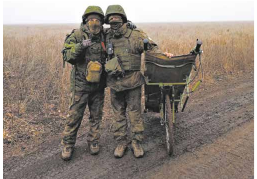
Раненых вывозят на носилках, закреплённых на моноколесе.