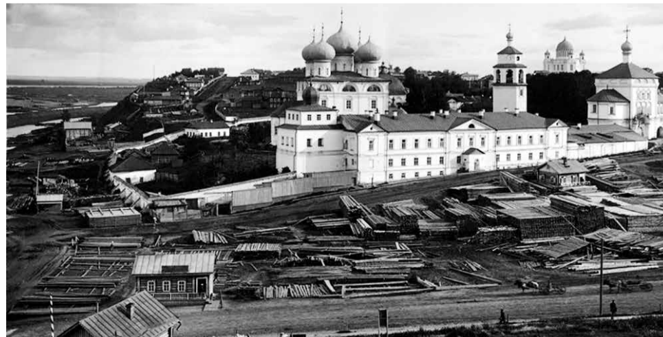
Старая Вятка: вид на Трифонов монастырь.