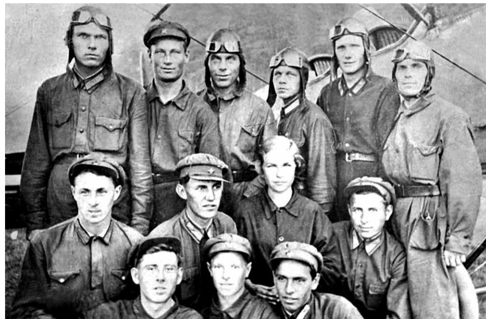
В едином строю боевые экипажи и специалисты-техники.

«Наш аэродром у Ладожского озера был замаскирован под торфяное поле. Лётчики работали по ночам, а инженеры и техники – и ночью, и днём. На аэродром самолёты возвращались буквально в лохмотьях. Надо было экстренно чинить искалеченные машины. Как-то раз только их собрали, и выпал снег. Тут же приказ – за ночь все перекрасить в белый цвет. Собрали белую краску по соседним артиллерийским и танковым подразделениям. Кистей не было, но к утру все 20 самолётов стали белыми. Красили и лётчики, и техники, и командир полка».