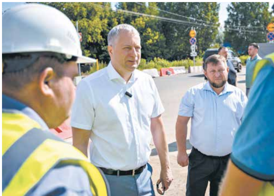
Контроль за ходом работ ведётся постоянно, с выездом на стройплощадку.

«Контролируем процесс, отмечаем, что темпы работ растут, подрядчик намерен вывести дополнительную