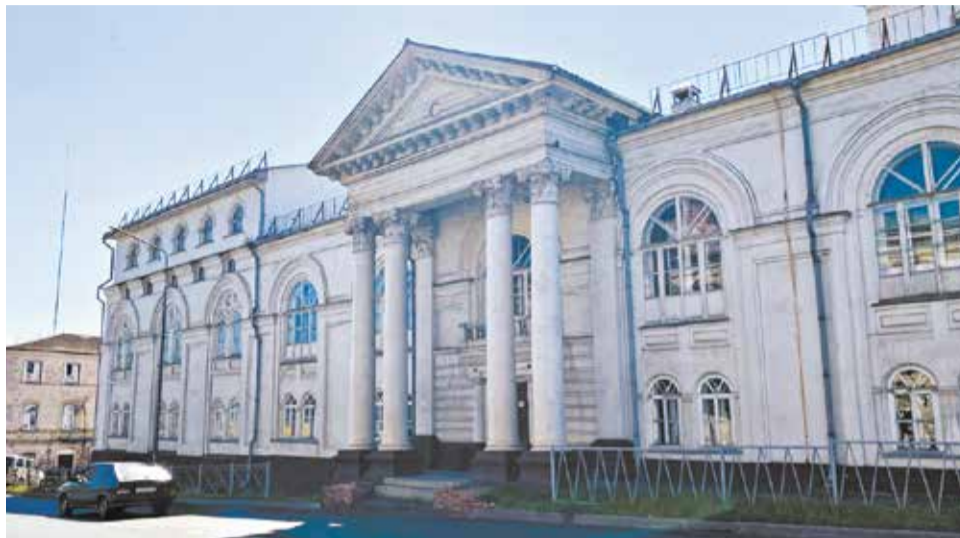
Торговый дом купцов Носовых, ныне – районный Дом народного творчества.

Устанавливала их подлинность специальная комиссия из Москвы с