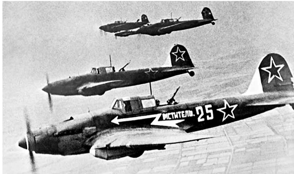
Лётчики, обученные в Кировском аэроклубе, воевали на всех фронтах.