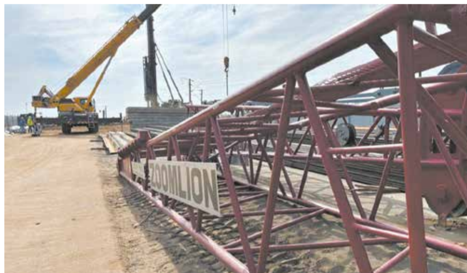
Подрядчик готовится к продавливанию грунта под ж.-д. путями.