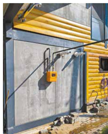
Завести газ в дом – непростая задача, нужна помощь специалистов.

Ваша задача – мечтать о тепле и уюте в своем доме, а наша – сделать эту мечту реальностью. Безопасно, надёжно и в понятные и конкретные сроки.