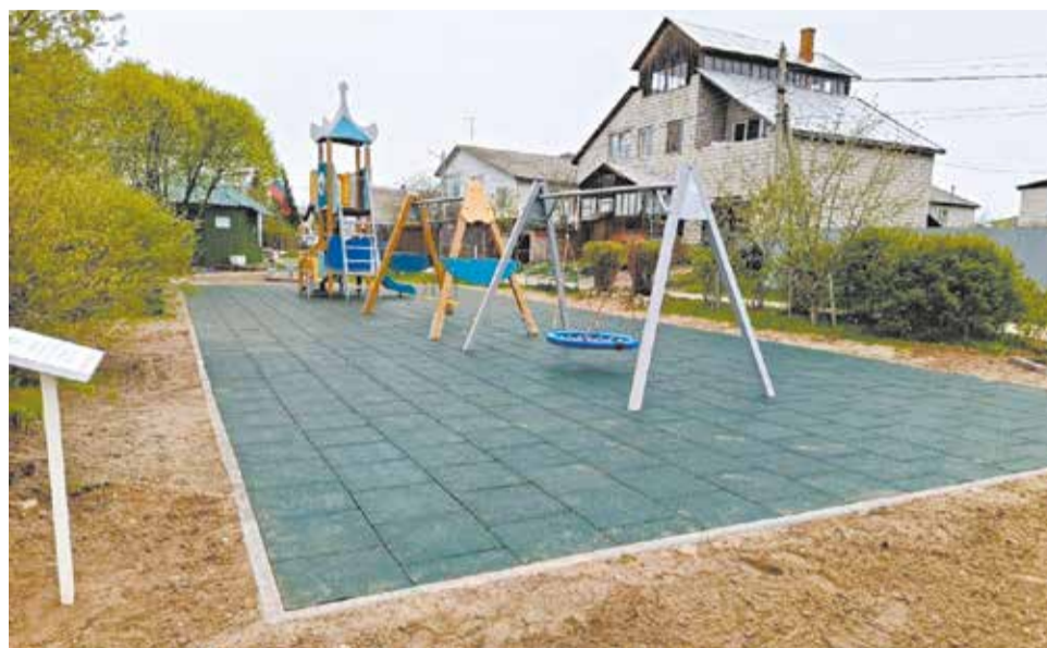
Детская площадка в Гнусино установлена, сейчас необходимо благоустроить место для мероприятий.

Заявки на ППМИ-2026 принимают до 15 сентября