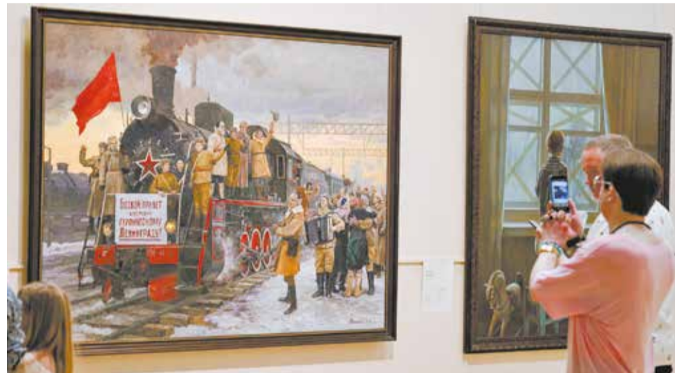
Выставка «Грековцы. Под знаменем Победы» будет работать до 12 октября. 6+