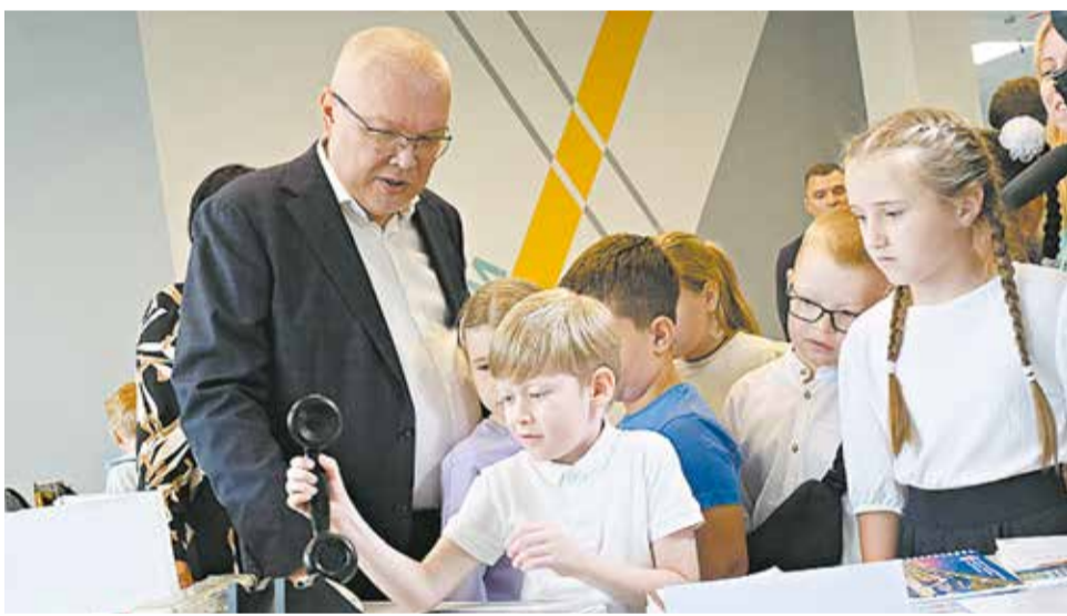
Глава региона осмотрел кабинеты, пообщался с будущими учениками.