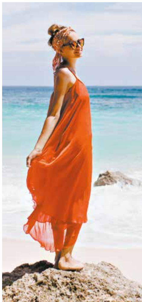
Хорошо отдохните в отпуске, чтобы впечатлений хватило на целый год.

Во многих городах проводятся бесплатные или недорогие обзорные экскурсии. Обычно о них можно узнать в информцентрах для туристов, расположенных возле достопримеча-