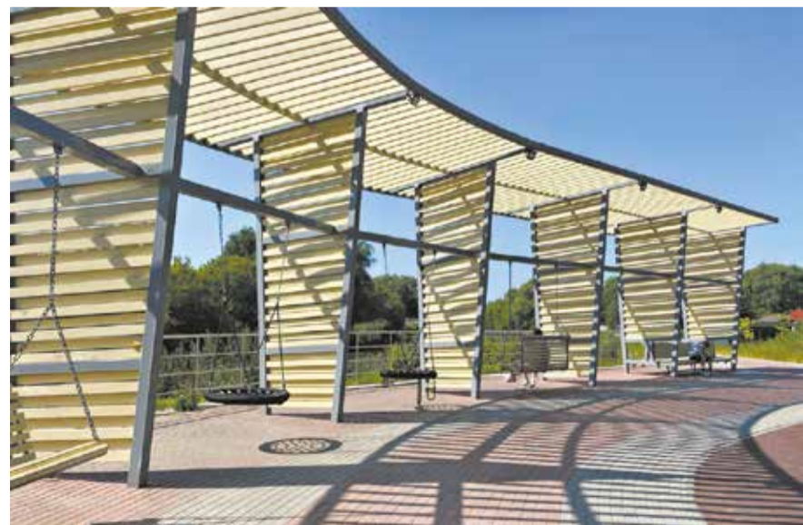
Качели на современной набережной Ярани.

А ещё из глины делали игрушки – когда оставалось время от кухонной утвари. Сегодня промысел сохранился в деревне Дворяне, где живёт мастерица Нина Колчина . Её игрушки в бело-голубых тонах узнаваемы и известны. По инициативе мастерицы в деревне открыт музей.