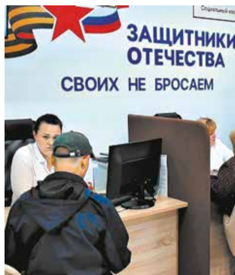
Бойцам помогают социальные координаторы.

сведениями на межведомственном уровне создана информационная система ГИС «Защитник Отечества». К ней подключили учреждения социальной сферы, системы здравоохранения, образования, кадровые центры.