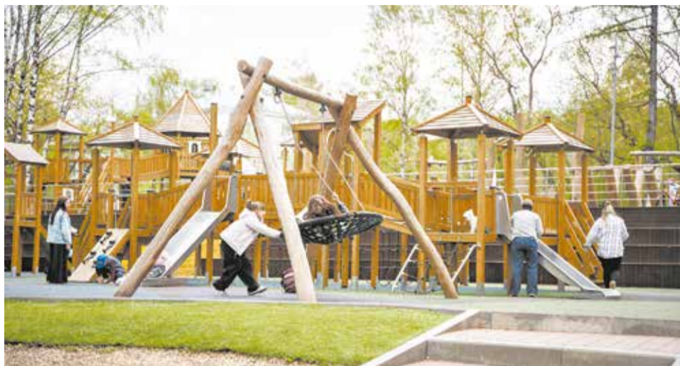
Парк стал комфортным местом отдыха благодаря нацпроекту.

«С представителями нового муниципального учреждения «Парк им. С.М. Кирова» обсудили вопросы обустройства цветников, деньги на которые предусмотрены контрактом. Отдельно остановились на арт-объектах в форме больших гладких камней-галеок. Их можно использовать в качестве скамеек, – рассказал