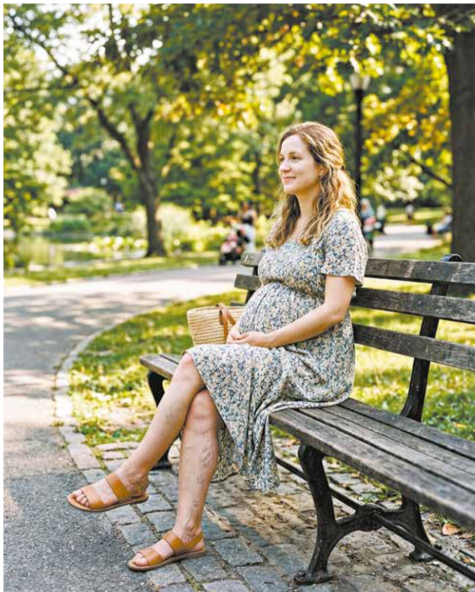
Беременность может спровоцировать развитие варикоза. Обязательно сходите на приём к флебологу!

Некоторые считают: если нет видимых вен, то варикоз не страшен. Это заблуждение. В любом случае обязательно проконсультируйтесь с флебологом. Грамотная профилактика и вовремя начатое лечение помогут сохранить здоровье и красоту