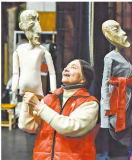
Заслуженная артистка РФ Галина Сарафаникова на репетиции.