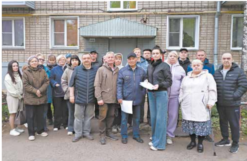
Ремонт во дворе обсудили жители дома по ул. Монтажников, 26.

В 2025 г. жители нашего дома по ул. Ленина, 1 в Лянгасово решили действовать активно и совместно и создали ТОС – орган территориального общественного самоуправления.