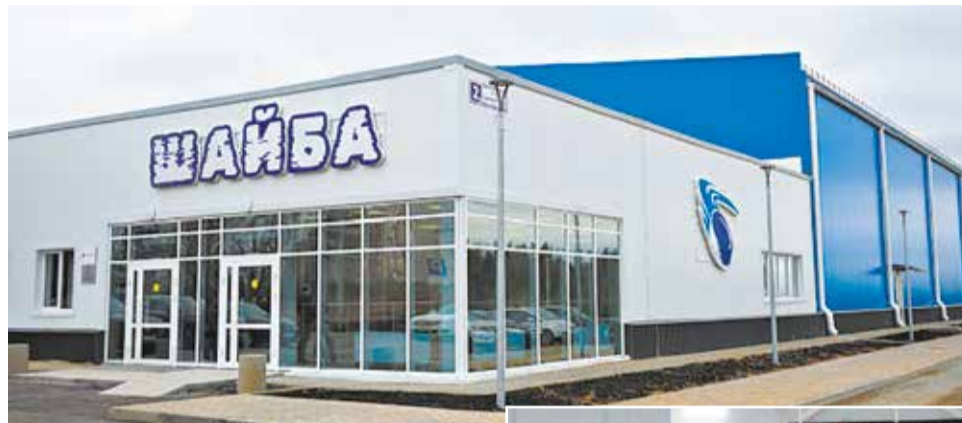
Каток с искусственным льдом – для хоккеистов и фигуристов.

Следующий этап – благоустройство территории вокруг катка. Также озвучены планы по созданию лыжероллерной трассы. С учётом строительства лыжной базы, в которое инвестирует ССК, в Радужном формируется зимний спортивный кла-