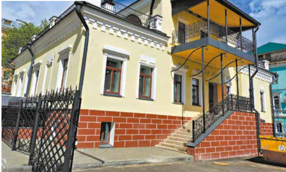
В отреставрированном здании планируют открыть музей-ресторан (вид со двора).