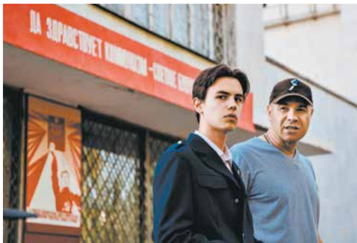
Кадр из фильма «Город Брежнев» про 1980-е.