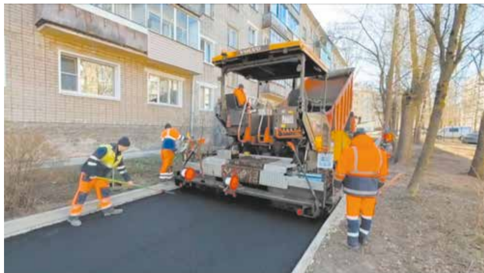
Работы во дворе дома на ул. Свердлова завершат при благоприятной погоде.