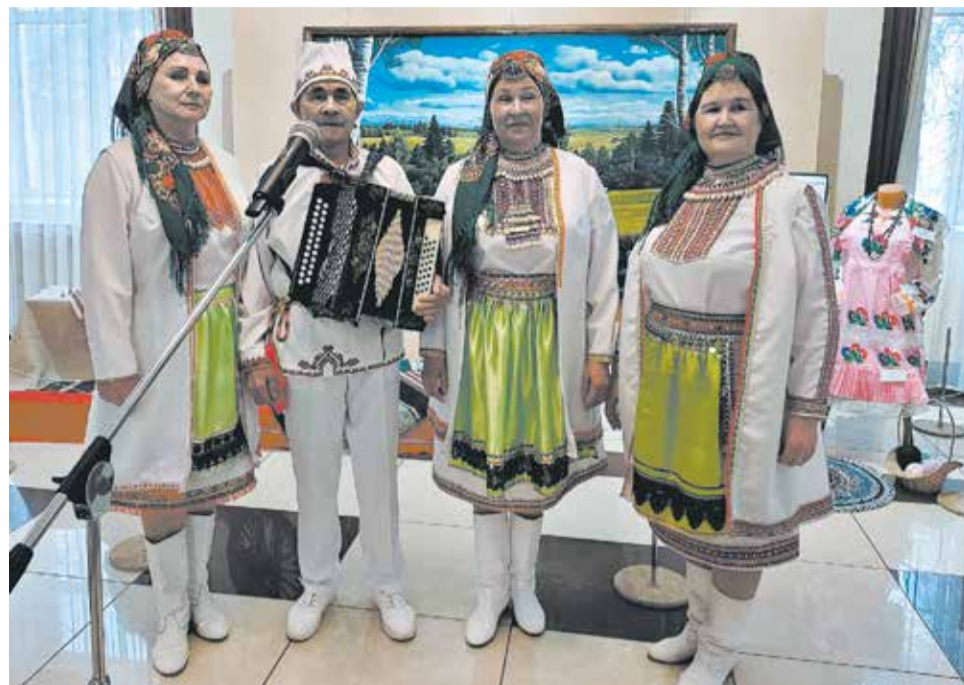
На открытии выставки выступил ансамбль «Кильмезь-мари».

Художник напомнил, что у народа мари особое отношение к воде. Не оскверняй её, иначе Мать Вода