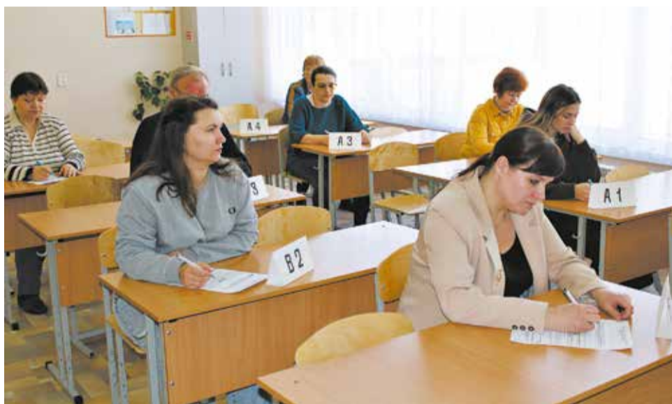
Взрослые написали проверочную работу по русскому языку.

18 апреля в школе № 8 прошла всероссийская акция «Сдаём вместе. День сдачи ЕГЭ родителями», а в школе № 59 – региональная акция «Сдаём ОГЭ вместе».