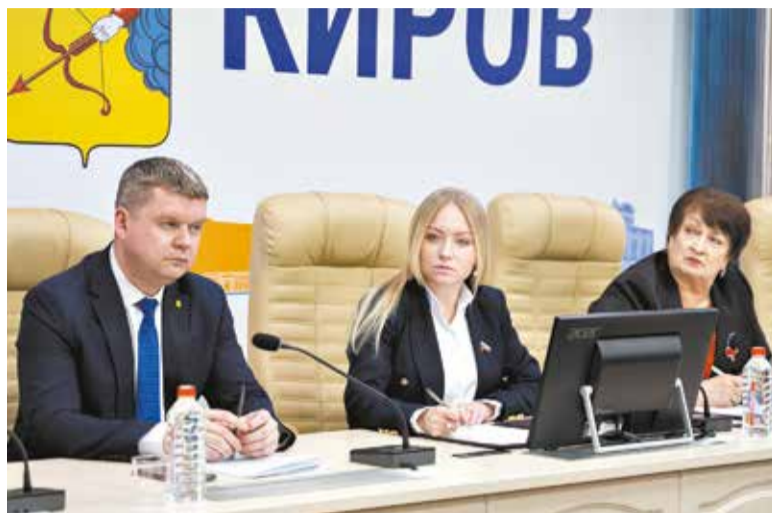
На комиссии по соцсфере обсудили состояние спортивных площадок в городе и перспективы их работы.

На ремонт спортплощадки на ул. Парковой в Нововятском районе из бюджета города выделены 2,9 млн руб. Уже прошла встреча с представителями подрядной организации из Кирово-Чепецка, которая имеет опыт работы на подобных объектах. До конца июня планируют заменить верхний слой волейбольной и баскет-