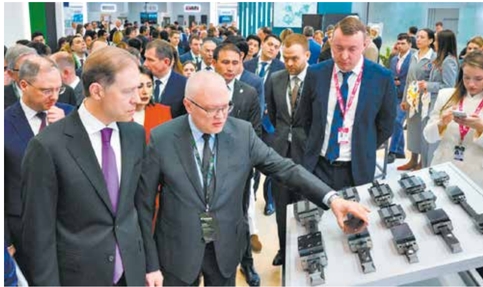
В числе гостей, заинтересовавшихся кировским стендом, – первый заместитель председателя Правительства РФ Денис Мантуров.

В ходе выставки наша делегация посетила стройплощадку логистического центра «Silkway Central Asia» в Ташкентской области. На территории Кировской области тоже строят крупный логистический узел «Северная широта» – для приёма, обработки, хранения и распределения продтоваров (до 360 тыс. тонн в год). Андрей