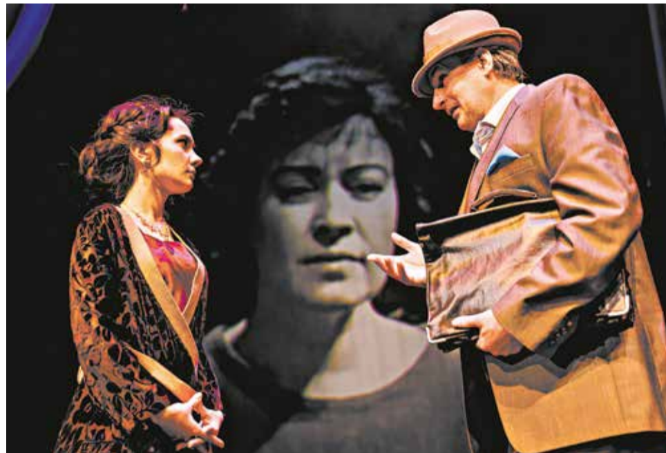
Спектакль «Мата Хари» – о трагической судьбе танцовщицы.

Драматический театр к 200-летию Салтыкова-Щедрина готовит спектакль «Современная идиллия» в постановке Игоря Лысова. В анонсе сказано, что это «самоучитель для благонамеренных идиотов». Сатирик, напомним, высмеял в книге и бюрократию, и людей, которые в смутные времена «переобулись» и