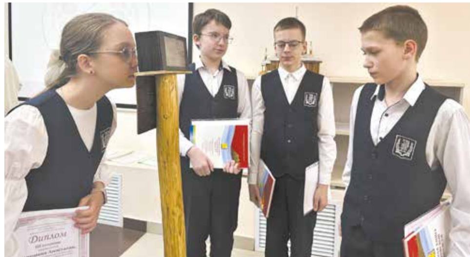
Прибор «Ретроскоп» создали учащиеся ВГГ.