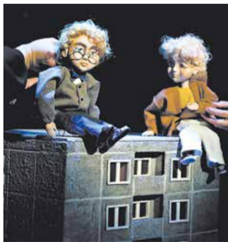
«Маленькие трагедии» – новое прочтение Пушкина.