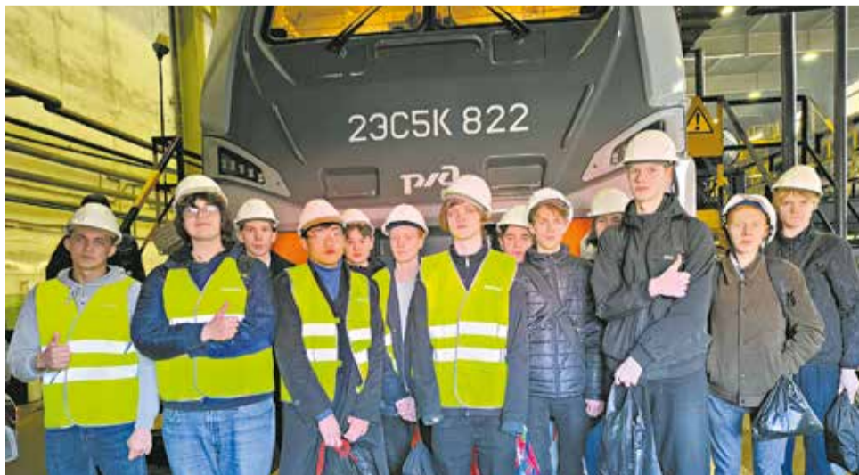
Ученики 10 «Б» класса школы № 73 побывали на разных участках депо.

Кстати. Акция «Неделя без турникетов» – это масштабный профориентационный проект, который позволяет молодому поколению познакомиться с реальным производством.