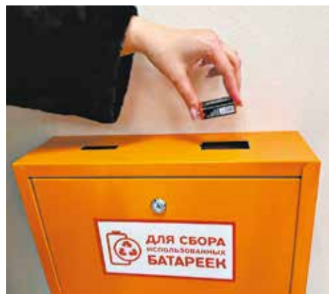
Утилизация батареек – вклад в сохранение окружающей среды.

Кировский филиал «ЭнергосбыТ Плюс» в 2025 году утилизировал 492 килограмма использованных батареек.