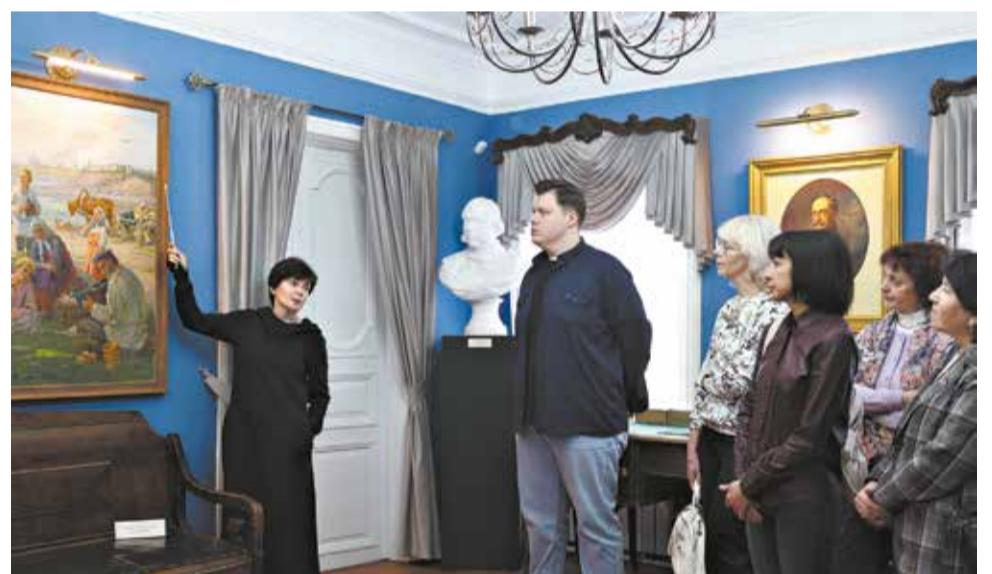
Дом-музей Салтыкова-Щедрина обновили к 650-летию города.

Этнокультурный фестиваль-лаборатория «Тропы» рассчитан на три дня и включает лекции, практические занятия, мастер-классы по локальной идентичности и народной культуре. Итогом станет перформанс «Вятка – дом пяти народов» для молодёжной аудитории, основанный на традициях, обрядах, музыкальном фольклоре региона. География проекта – Киров, Белая Холуница, Яранск. Старт в июне.