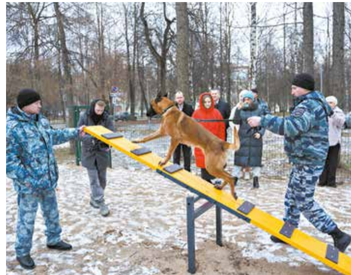
Новую площадку в парке имени Гагарина опробовали специалисты-кинологи.