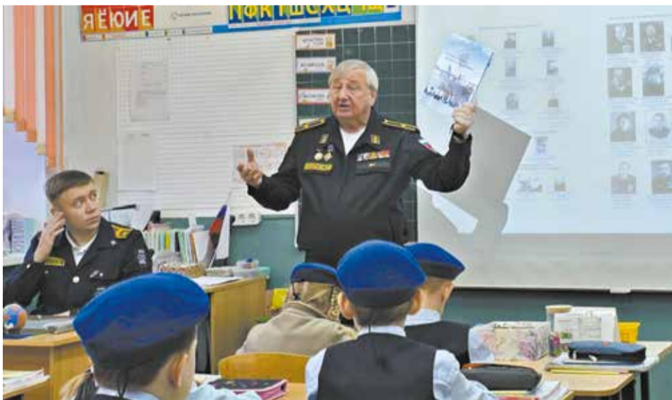
Юнармейцы школы № 70 прониклись военной историей России.