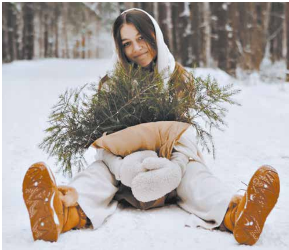
Зимой нужно особенно внимательно относиться к своему здоровью.

Наверняка многие сталкивались со стержневыми мозолями, которые могут появиться на стопе, на пальцах или между пальцами именно в