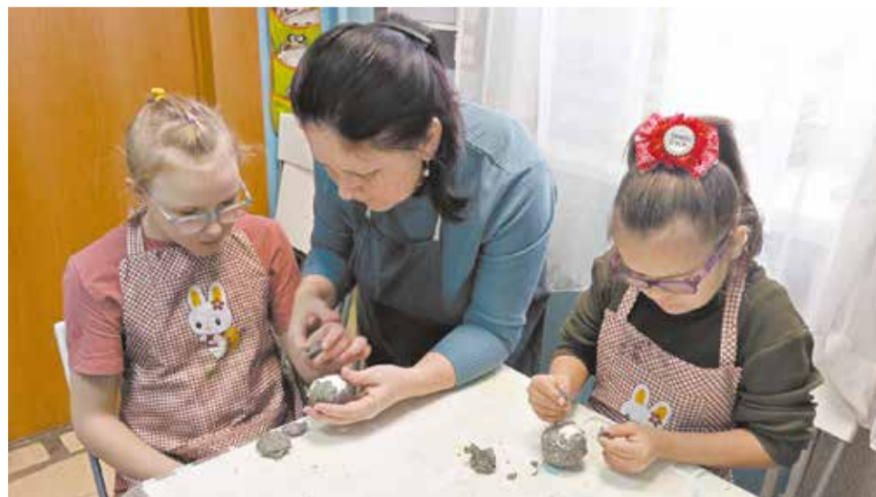
Занятия помогают ребятам и взрослым обрести опору в жизни.