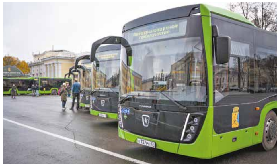
Автобусы, купленные по нацпроекту, презентовали на Театральной площади.

Также с 1 января короче станут маршруты автобусов № 26 и 90 – конечной остановкой у них будет «Слобода Курочкины», а не «ТЭЦ-5». До ТЭЦ от Курочкиных запустят закольцованный рейс с отдельным информационным аншлагом – в рамках маршрута № 90 (пассажиры с 26 и 90-го автобусов смогут пересечь на