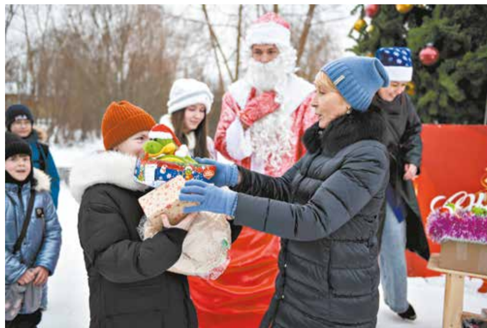
Победителей новогодних конкурсов награждают руководители города.

Территориальные комиссии до 6 февраля отберут пять претендентов в каждой номинации, затем их проекты оценит конкурсная комиссия. Дополнительные баллы будут начислять за наличие малых архитектурных форм, снежных и ледяных