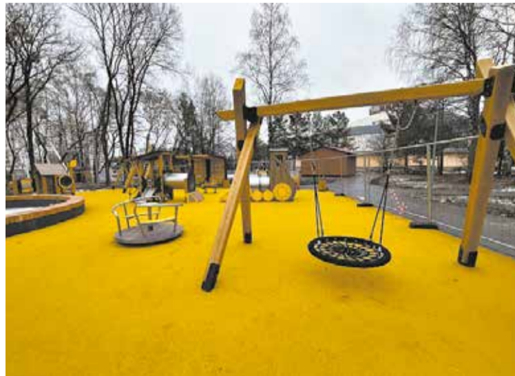
Ещё одна площадка в парке имени Кирова с резиновым покрытием, горками, качелями – для самых маленьких.

оба моста, построен новый пирс, по всему парку проложены кабельные линии, смонтировано освещение, дорожки выложены брусчаткой. Новый гранитный постамент появился у скульптуры «Ассоль».