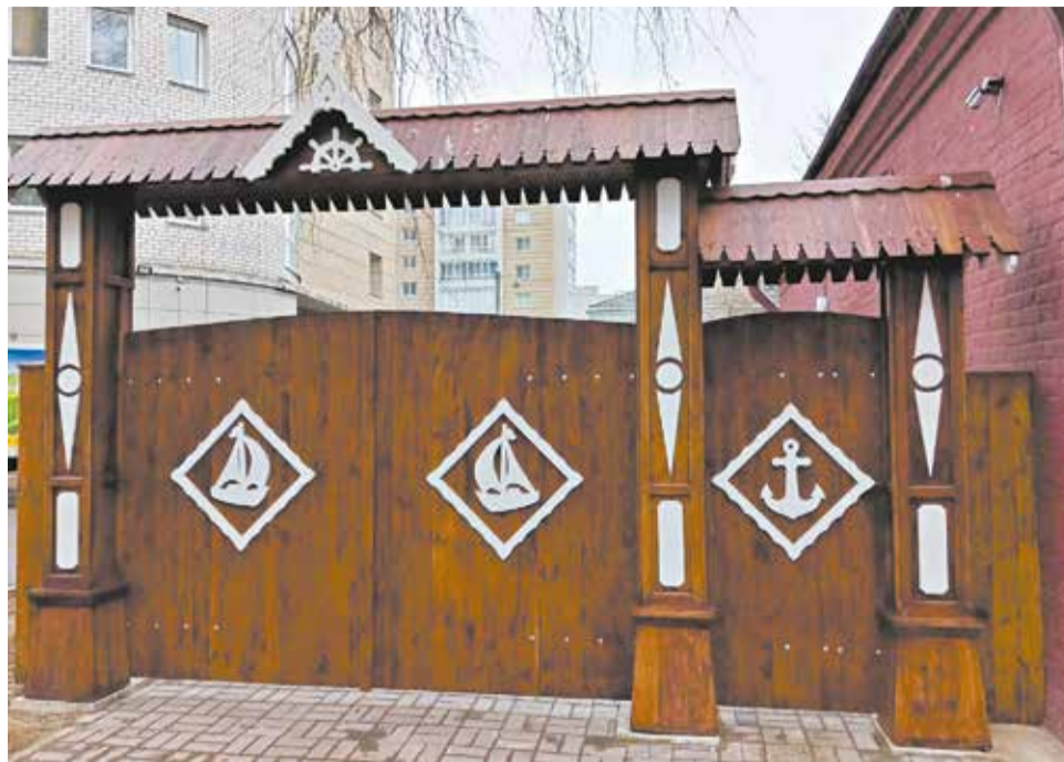
Ворота музея Грина украшены морской символикой.

«Радуется, что музей реставрируется, экспозиция обновляется. Надеюсь, через эти ворота пройдет немало экскурсантов», – заключила она.