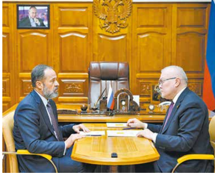
Полпред Игорь Комаров оценил успехи, поставил задачи.

«В Кировской области реализация всех этих задач, поставленных Президентом, – в числе приоритетов, – сообщил Александр Соколов . – Наи-