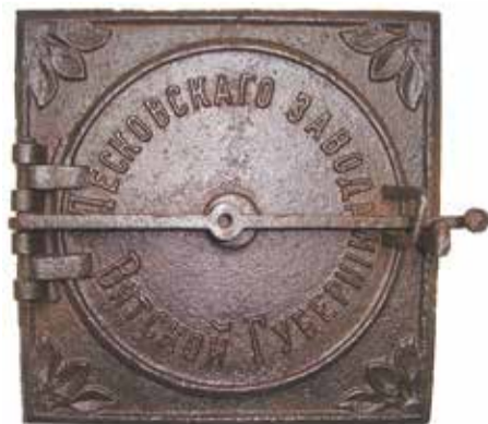
Печная дверца Песковского завода.