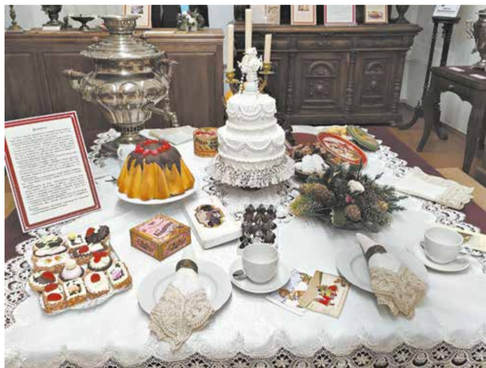
На чайном столе – копии десертов, которые продавали в вятских кондитерских.

Приказная изба приглашает на «НескуЧАЙную выставку»