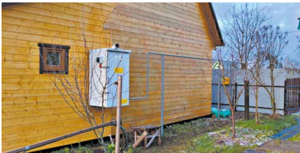
Завести газ в дом – непростая задача, нужна помощь специалистов.

Ваша задача – мечтать о тепле и уюте в своём доме, а наша – сделать эту мечту реальностью. Безопасно, надёжно и в понятные и конкретные сроки.