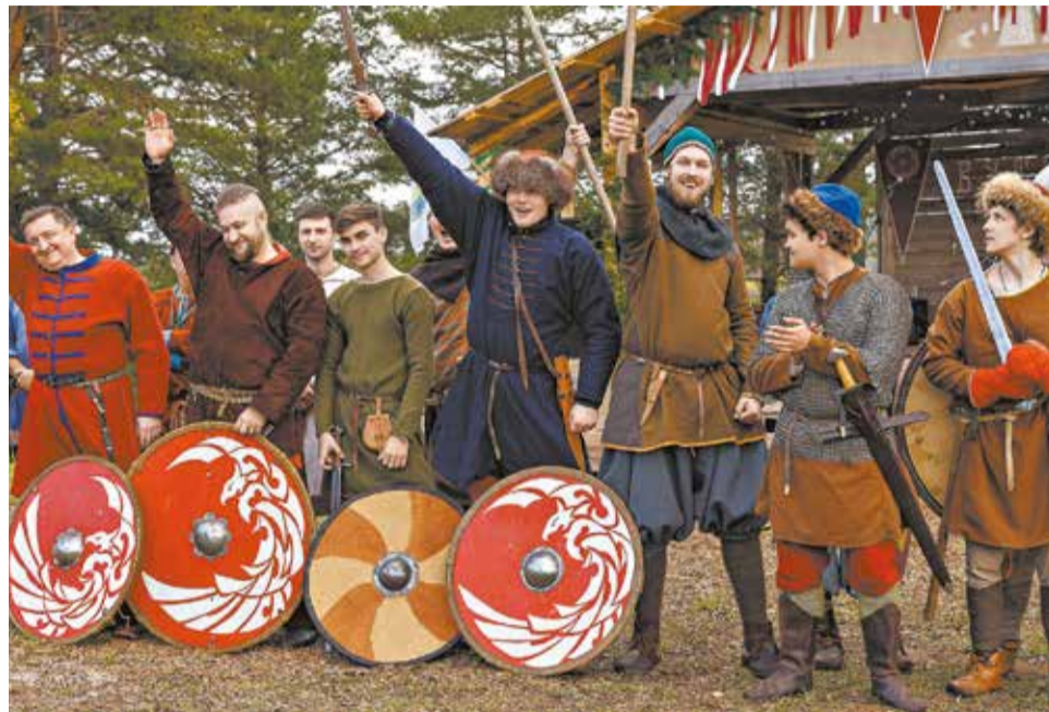
Клуб «Хлыновская застава» будет проводить выездные выставки и экскурсии.

Господдержку получают шесть кировских проектов