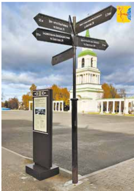
В Слободском установили новую навигацию для туристов.