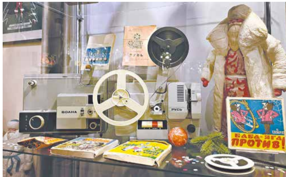
«Русь» и «Волна» – популярные советские кинопроекторы.

ночь» крутили лишь в кинотеатрах. А тут кинематограф сам пришёл к телезрителям!