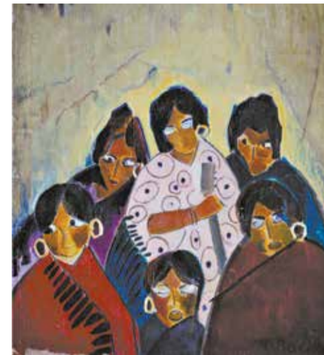
Цыганки. 1920 г.

превратить в весёлое приключение. Даже обычные вещи, балаганские игрушки становились у него сказочными. Однако выставлять живописные работы он не мог из-за обвинений в формализме, поэтому занялся детской иллюстрацией.