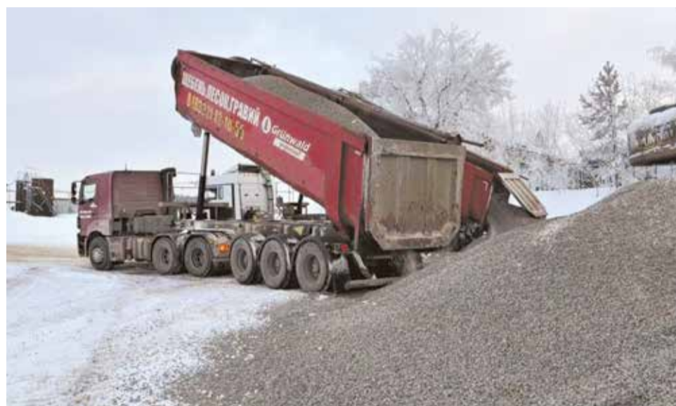
Завоз строительных материалов для обновления автотрасс уже начался.