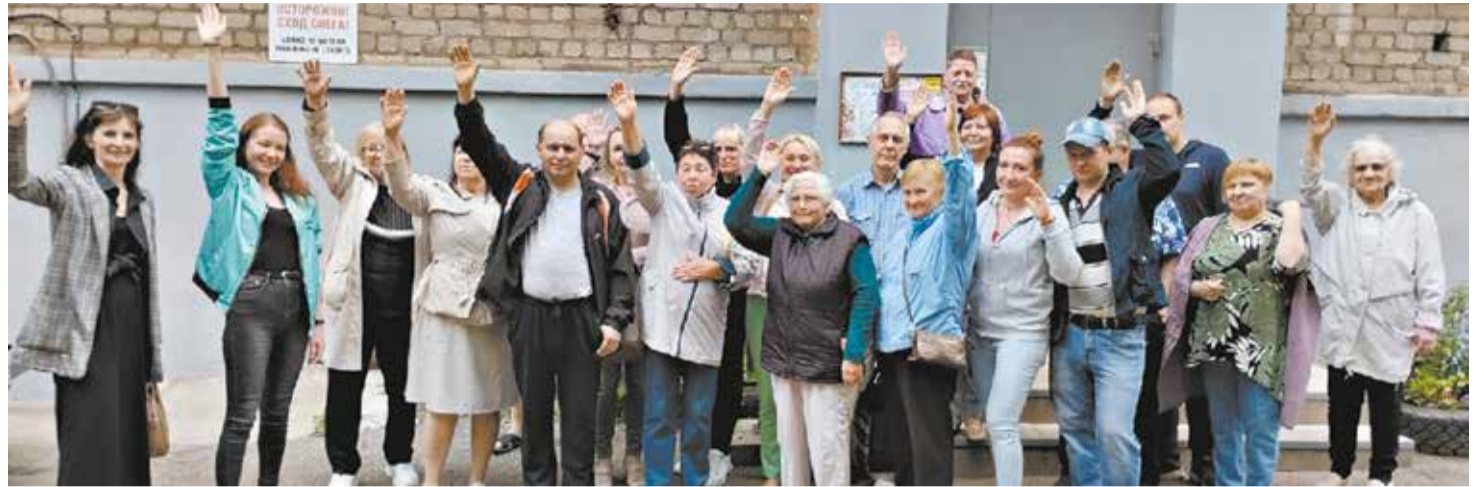
Кировчане голосуют за обновление придомовых территорий, появление новых зон отдыха, спортивных и игровых площадок.

«В основном горожане хотят отремонтировать проезды, тротуары или парковки на своих придомовых территориях. Также актуально создание детских игровых и спортивных площадок, – сообщил Дмитрий Медведев , начальник управления организационной работы администрации города. – Что касается общественных территорий, то в порядок будет приведена волейбольная площадка у дома № 3 на улице Индустриальной в Радужном. Рядом с домом № 2/4 на ул. Красный Химик обустроят пешеходную зону и выполнят озеленение, у дома № 2 на ул. Заозёрной в слободе Леваша создадут детскую площадку».