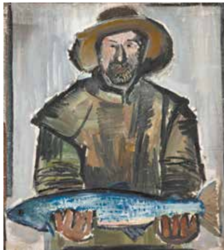
Рыбак с сёмгой. 1931 г.

Дед рассказывал, что героиню заметил в электричке. Якобы из сумки колоритной дамы выскочила белая мышка и села ей на плечо. Потом по памяти он нарисовал этот сюжет. Неизвестно, была эта встреча реальной или дедушка её придумал. Он любую, казалось бы, бытовую историю мог