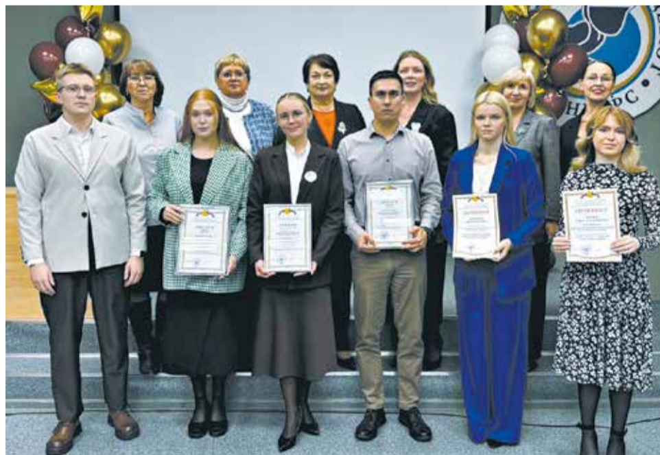
В конкурсе «Педагогический дебют» в 2025-м участвовали шесть учителей.

На базе информационно-методического центра системы образования