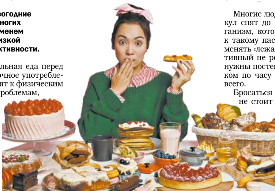
Сладости выглядят привлекательно, но лучше ими не злоупотреблять.

Чтобы сбросить набранный вес, достаточно ограничить калорийность рациона всего на 300-500 килокалорий в сутки. Делать это надо постепенно, с той скоростью, которая комфортна для тела. Кому-то понадобится всего неделя, кому-то месяц. Оптимальным считается потеря от 0,5 до 1 кг.