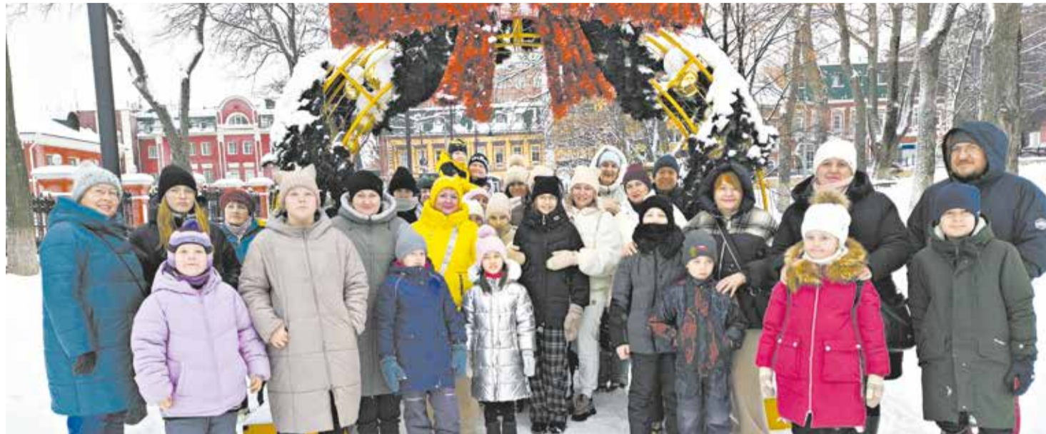
Гости, прибывшие на поезде «Вятская сказка», у Спасского собора и Ворот Русского Севера.

инфраструктура, доступность объектов, безопасность, аспекты устойчивого развития и др.