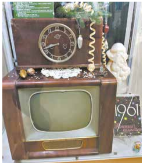
Телевизор «Рекорд» 1950–1960 годов.

Очень понравилась фотозона с фрагментом съёмки «Карнавальная ночь» (1956). К стати, 1 января 1959 года кировчане смогли посмотреть комедию Эльдара Рязанова на своих экранах. Это стало большим событием, ведь ещё недавно «Карнавальную