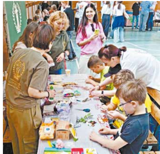
Проект по проведению турнира «В яблочко» включал не только соревнования, но и мастер-классы с детьми.

культурных традиций, промыслов, развитие художественного творчества;