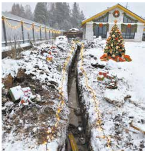
Завести газ в дом – непростая задача, нужна помощь специалистов.

Ваша задача – мечтать о тепле и уюте в своём доме, а наша – сделать эту мечту реальностью. Безопасно, надёжно и в понятные и конкретные сроки.