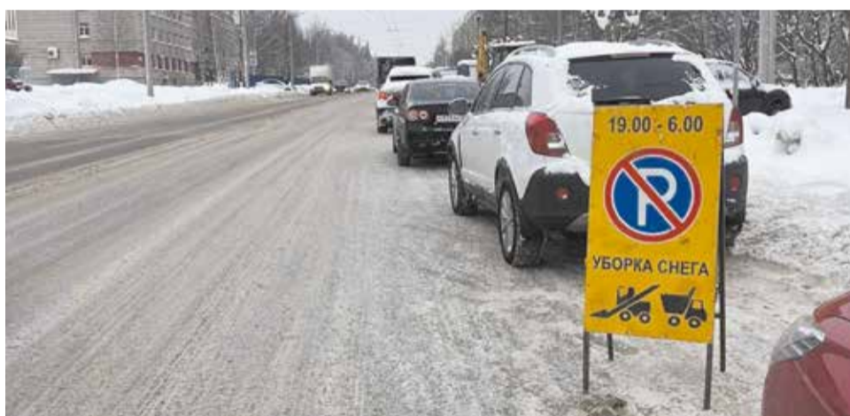
Дороги чистят городские подрядчики, заранее выставляя знаки.

заранее выкладываем в придомовых чатах или извещаем старших по домам, – рассказала она. – Порой, чтобы не повредить автомобили, очистку кровли приходится откладывать или выполнять не в полном объёме».