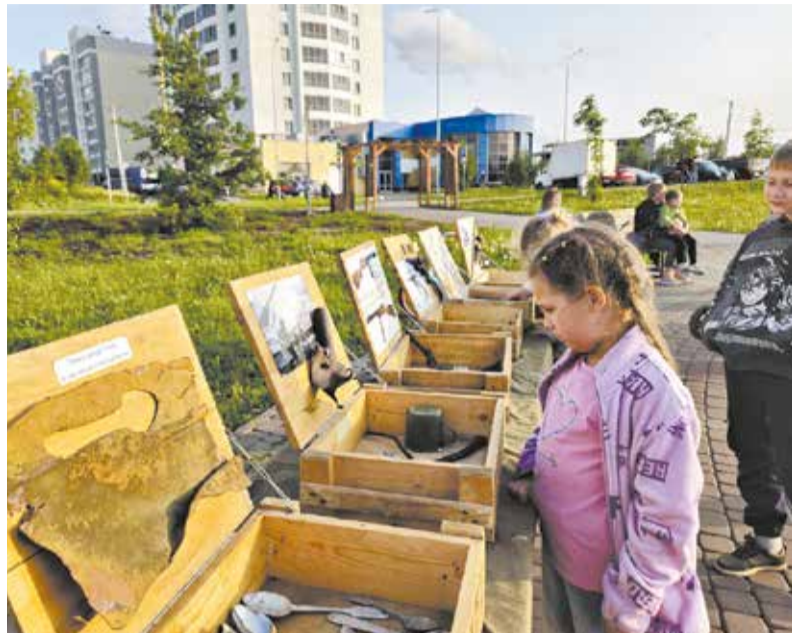
Перед сеансами кино под открытым небом можно было осмотреть экспонаты, собранные кировскими поисковиками.