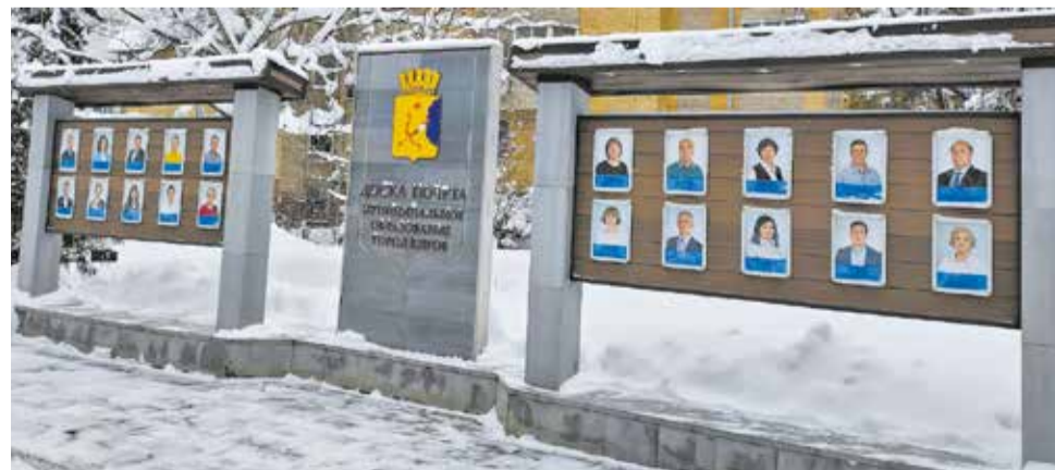
Кандидатуры выдвигают городские предприятия, организации и учреждения, учитывая заслуги своих сотрудников.

Документы принимают до 1 апреля по адресу: ул. Воровского, 39, каб. 202. Подробности по тел. 76-04-77.