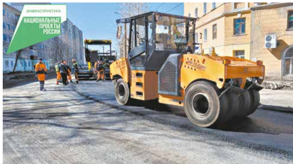
К дорожным работам в этом году планируют приступить как можно раньше.

Кроме того, в новом году продолжат установку линий освещения вдоль трасс – их общая протяжённость составит 139 км (95 населённых пунктов).