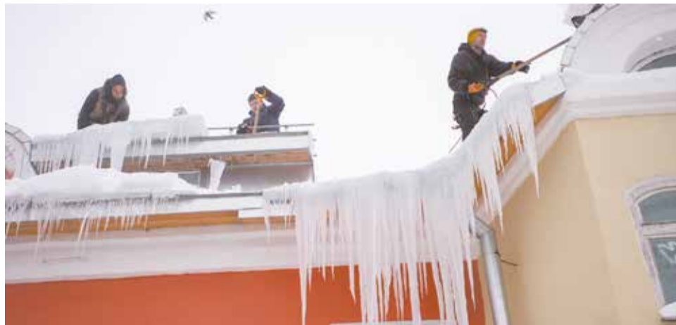
За очистку крыш отвечают управляющие компании.