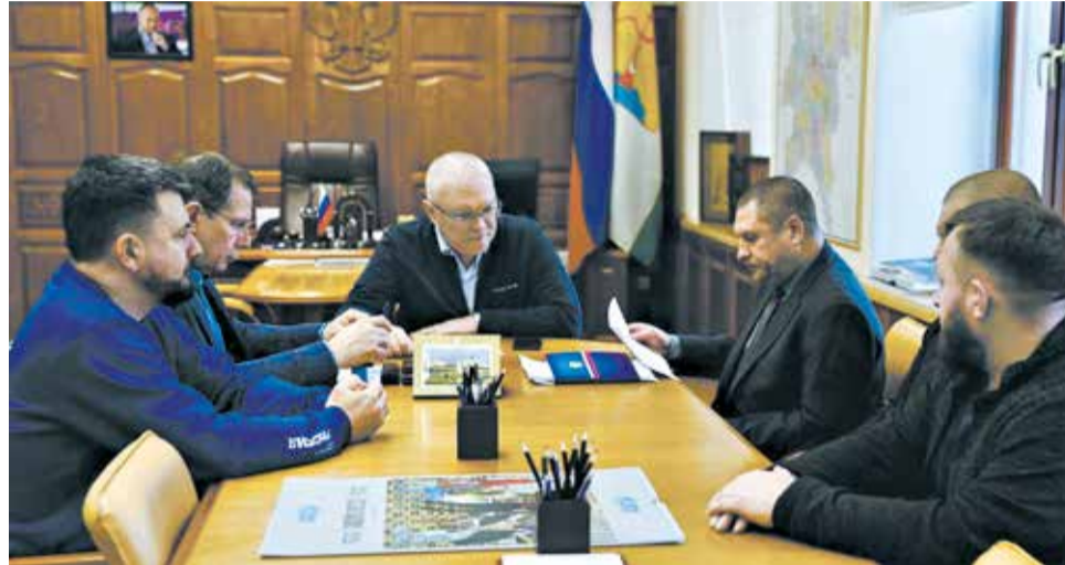
Глава региона принимает отчёты по обстановке в области от оперативных дежурных и ответственных лиц.